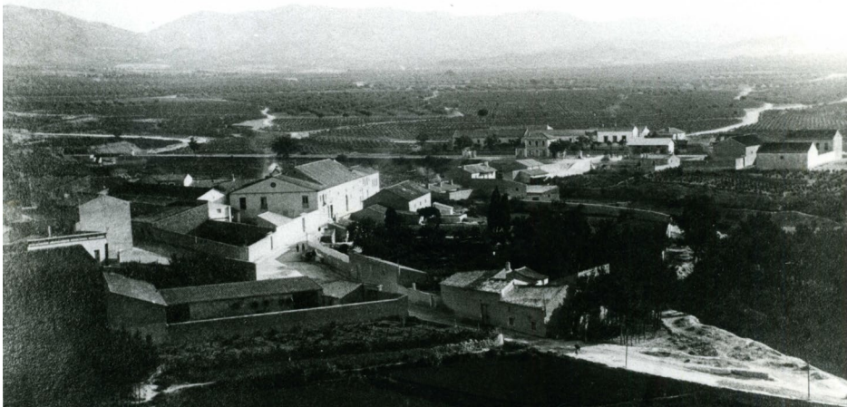
Figura 3. Vista panorámica del barrio de la Estación desde el Castillo de Sax, en 1917.