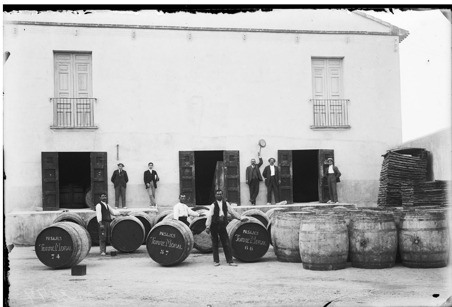
Figura 2. Una bodega en el barrio de la Estación, a comienzos del siglo XX.

otra bodega en la calle Palmera, y 4 bodegas en la plaza del Hoyo. Todas estas suman 87 construcciones dedicadas a bodega dentro del núcleo urbano de Sax en el año 1893.