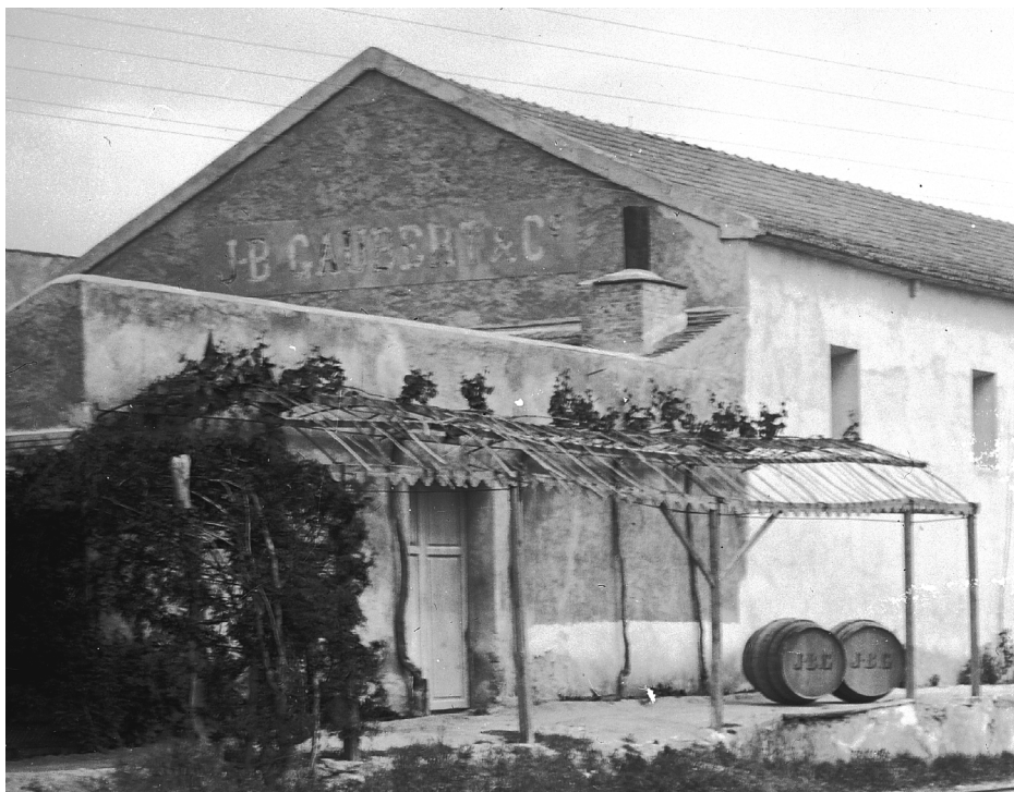
Figura 6. Panorámica de las bodegas de Gaubert, junto a las vías férreas, en 1903.

-Julia Jordá, nacida el 6-12-1864, de 33 años, natural de Alcoy (Alicante), casada, su sexo.