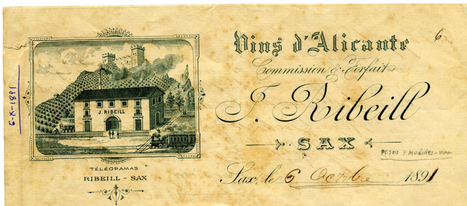
Figura 7. Membrete de las cartas de la familia Ribeill en 1891.

Pero esta carta no es el único testimonio de la presencia de los Ribeill en Sax en los años finiseculares, pues su apellido lo encontramos en