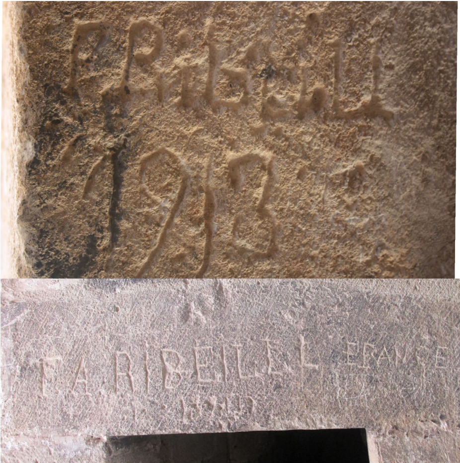
Figura 8. Grafiti en el Castillo de Sax, en la puerta de entrada a la torre del homenaje, con la siguiente inscripción: F. A. Ribeill France 1899 . Grafiti en el Castillo de Sax, en la puerta de la torre almohade, con la siguiente inscripción: P. Ribeill 1913 .

los grafitis del castillo (Vázquez y Galvañ, 2012). En la segunda mitad del siglo XIX la sociedad sajeña experimenta una gran transformación, fruto de la riqueza que terratenientes y comerciantes adquieren gracias a la exportación del vino por ferrocarril al puerto de Alicante, con destino a Francia. Así, las clases más favorecidas adquieren una conciencia burguesa y desarrollan nuevos hábitos sociales, entre los que podemos destacar el disfrute del ocio y del tiempo libre, con excursiones y visitas