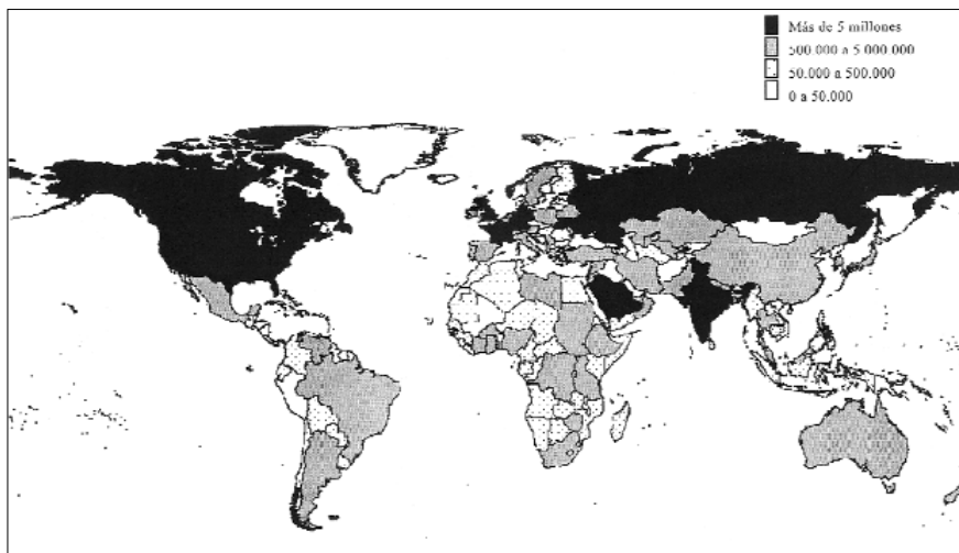
Mapa 1. Número estimado de migrantes internacionales (de ambos sexos) año 2005.