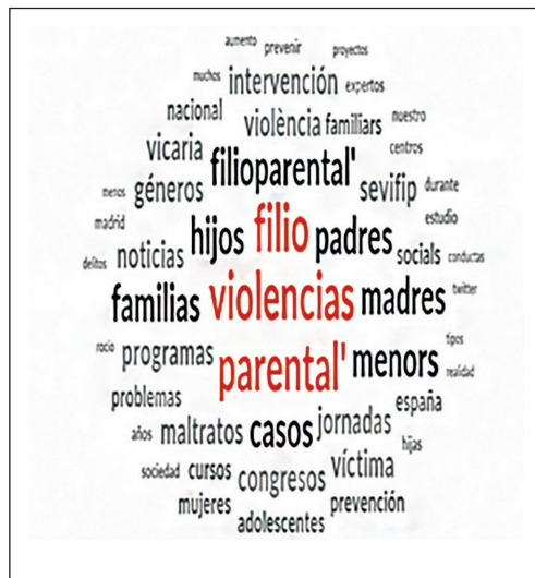
Figura 1. Nube de frecuencias

En la figura 1 se muestra la nube de frecuencias de los términos más utilizados en el corpus de mensajes. En ella destaca la frecuencia de términos comunes como hijo, filio, padres, violencias, pero también se observa una considerable frecuencia de términos asociados a la formación e intervención en la violencia filio-parental: congreso, programas, intervención. Por otro lado, es significativo la alta frecuencia de los términos vicaria, el decimoséptimo y Rocío el cuadragésimo quinto. Estos términos solo se utilizan desde el pasado año y están vinculados al discurso generado tras la emisión de los programas del grupo Mediaset. La tabla 4 muestra la clasificación de las temáticas principales del corpus de tuits analizado a partir de la identificación automática obtenida con NVIVO 12.