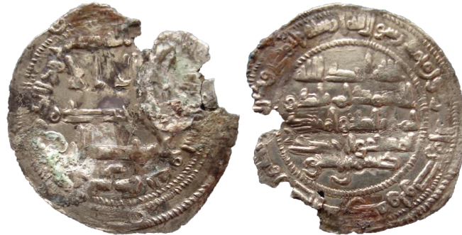
Figure 3. Dirham frappé au nom de Daysam ibn Ishāq en 293 AH / 905-6. Ech.2:1.

Enfin, un dirham découvert au château d'Albalat (Castellón) a été publié en 2015. La monnaie, qui semble avoir été percée et à laquelle manque une portion de bordure, pèse 2,05 g pour 28,5 mm. Datée 293 AH / 905-6, année de la mort de Daysam, elle est, comme la monnaie précédente, de type omeyyade, avec la mention de l'atelier d'al-Andalus au droit et la sourate CXII au revers, là encore suivie par le nom du rebelle 22 (fig. 3).