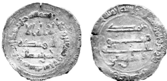
Figure 1. Demi dirham frappé au nom de Daysam ibn Ishāq en 277 AH / 890-1. Ech. 2:1.

Un demi dirham de type abbasside / aghlabide, avec au revers la mission prophétique de Muhammad et le nom de Daysam ibn Ishāq, a été publié par S. Fontenla Ballesta en 1995 17 . Daté 277 AH / 890-1, il pèse 1,3 g pour un diamètre de 20 mm. Bien que la monnaie ne mentionne pas l’atelier (par manque de place, précise-t-il), il s’agit vraisemblablement de Lorca 18 (fig. 1).