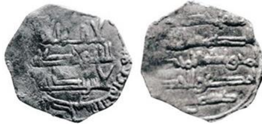
Figure 2. Fals ou demi dirham frappé au nom de Daysam ibn Ishāq en 288 AH / 901. Ech. 2:1.

Pour S. Fontenla Ballesta, ce serait un demi dirham fourré ou de très bas aloi, plutôt qu'un fals et la date serait bien 288 AH / 901, le 8 des dizaines étant bien visible 21 (fig. 2).