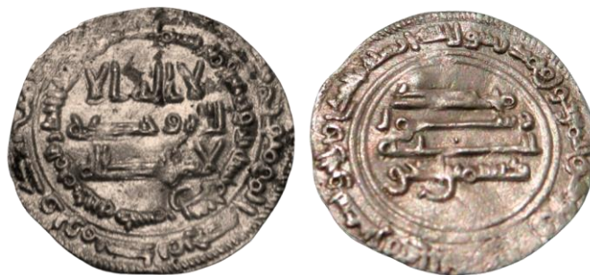
Figure 4. Demi dirham frappé au nom de Daysam ibn Ishāq en 273 AH / 886-7. Ech.2,5:1.

La monnaie que nous présentons ici (fig. 4) est donc la quatrième connue pour Daysam ibn Ishāq. Il s'agit d'une monnaie qui semble de bon argent, de module plutôt faible (18 mm) et pesant 1,2 g, ce qui correspond à un demi dirham.