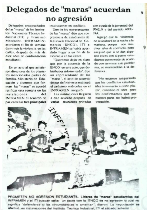
Imagen 1. Pacto de no agresión entre “maras”, 1992.