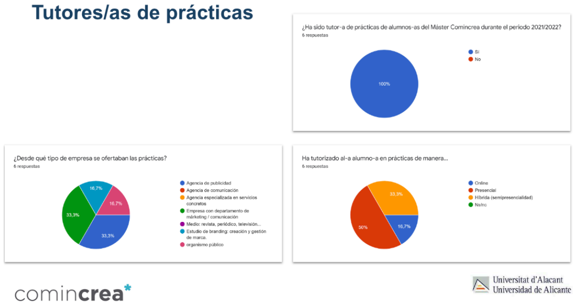
Figura 3. Respuestas tutores de prácticas.