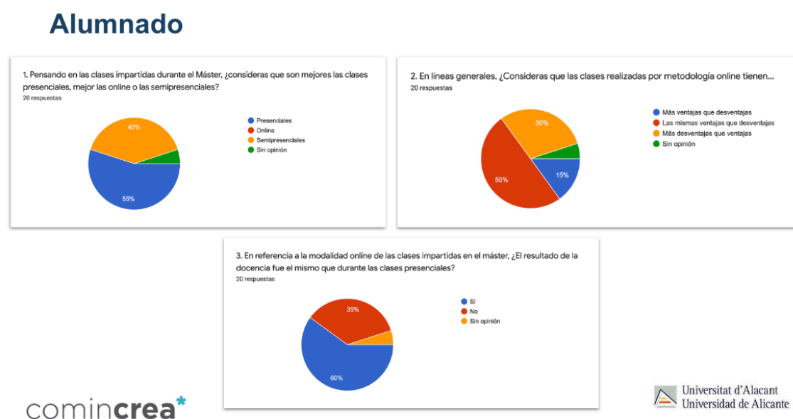
Figura 2. Respuestas alumnado

En Desde el punto de vista del alumnado, la experiencia híbrida Comincrea* ha sido positiva, como muestra la figura 2. El alumnado de Comincrea* encuentra práctico el poder desarrollar las clases de forma semipresencial. Existe interés por parte del alumnado en tener opciones a la hora de tener clases, en caso de enfermedad, trabajo, entre otros, por lo que encuentra favorable la opción clases semipresencial. En concreto el alumnado de Comincrea* considera positivo que las clases sean impartidas de forma semipresencial.