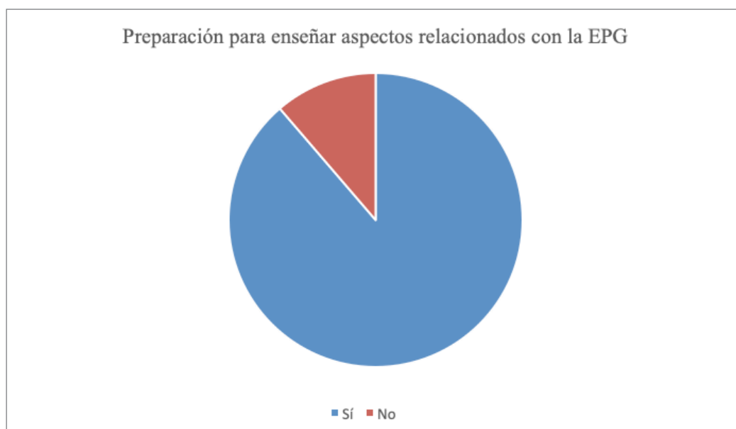
Figura 1. Pregunta 4. Preparación para enseñar aspectos relacionados con la Educación con Perspectiva de Género

El dato presentado en el párrafo anterior contrasta con la respuesta a la pregunta 4 en la que la gran mayoría, es decir, casi el 90%, concretamente el 88,7%, sí se considera preparada para enseñar aspectos relacionados con la Educación con Perspectiva de Género a su alumnado tras acabar los cursos frente a un 11,3%, tal y como se puede observar en la Figura 1.