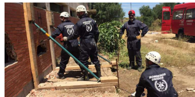
Terremoto Haití. 2010