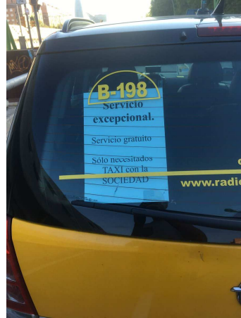
Atentado terrorista, Barna 17A, 2017