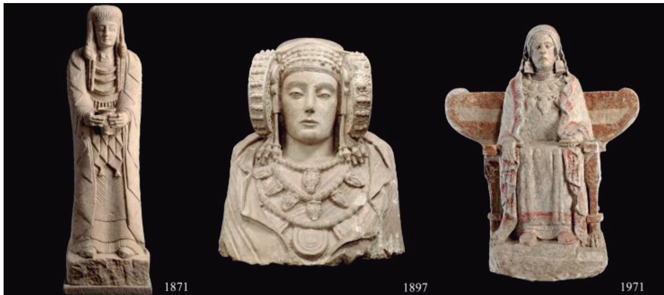
Fig. 4.-Dama oferente del Cerro de los Santos, Dama de Elche y Dama de Baza.