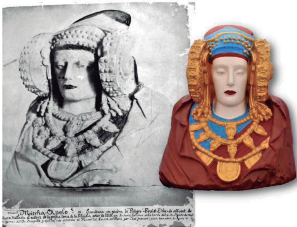
Fig. 3.-Fotografía manuscrita y sobrepintada por Pedro Ibarra Ruíz de 30 de agosto de 1897 (AHME-Archivo Histórico Municipal de Elche). Reproducción de la Dama pintada con sus colores originales (LA-6393. Foto J. L. Martínez Boix).

Siempre mantuvo la esperanza de que aquel hallazgo fortuito iba a atraer el interés científico y fondos que permitieran excavar en extensión, por lo que continuó haciendo de intermediario en los asuntos arqueológicos de la loma , y aunque pudo frecuentar las excavaciones en 1905 de Eugène Albertini –discípulo de P. Paris– y la de Vives Escudero en 1923, la fortuna no estuvo a la altura de sus sueños (Ronda 2018b: 30-39).