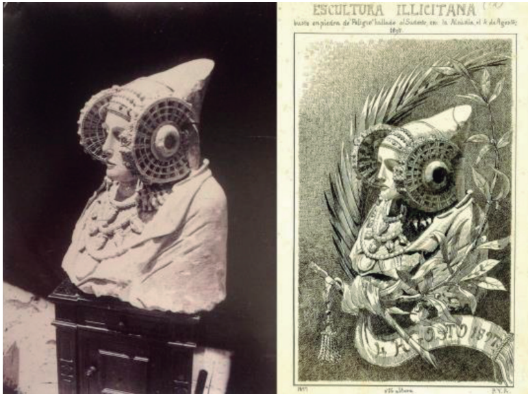
Fig. 2.-Primera fotografía realizada al busto el 5 de agosto por José Tomás Picó y Salvador Picó Martínez ( Cien años de una Dama 1997: 93, foto 1). Dibujo de Pedro Ibarra con una composición alegórica del hallazgo inspirada en esta fotografía (Fondo documental A. Ramos Folqués. FLA).

Aquella misma noche [...] tuve la satisfacción de admirar aquella maravilla. Veía ante mi una simbólica representación de alguna deidad primitiva local, cuyo estudio serviría de tema a no pocos arqueólogos, y, cuyo dibujo reproducirían todas las ilustraciones de Europa, tan pronto como la fotografía representara aquel sin igual portento (fig. 2) (Ibarra 1926: 196).