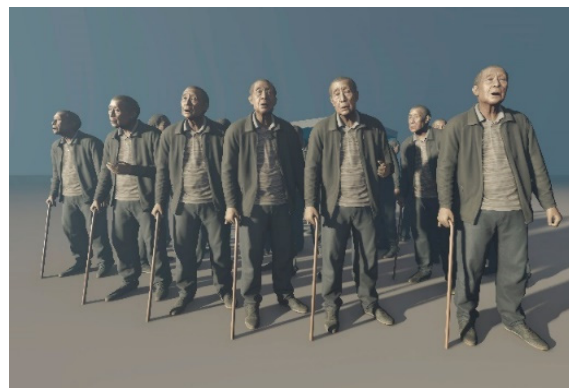
Figura 6. Superposición de secuencias partir de un mismo elemento que incorpora el movimiento por defecto. Lumion v11

- Ejercicios de ficción y combinación: Análisis de parámetros móviles y secuenciales que, aunque imposibles o irreales (Fig. 6) puedan ayudar a explicar y comunicar ciertas características del objeto de representación.