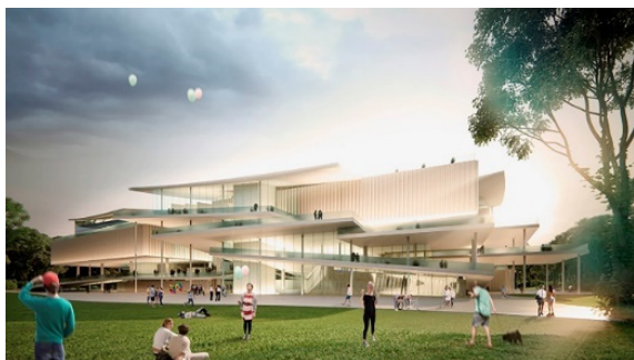
Figura 5. Sanaa. Galería Nacional en Budapest 2015.

Al entender la imagen arquitectónica como fotograma estamos asumiendo su inevitable posicionamiento con respecto al vector del movimiento y el cambio. El fotograma lo es, siempre y sin excepción, en relación a otros homólogos con los que se relaciona y ordena: con los que crea secuencia. La imagen de arquitectura, hasta ahora estática por definición, podía entenderse como instantánea fotográfica en la que lo dinámico (fundamentalmente las luces, las sombras o las acciones) quedaba congelado o, cuando menos, desdibujado frente al mudo erigir de la geometría material que conforma los espacios arquitectónicos. No obstante, cada vez más, la idea de que “la ciudad actual ya no puede entenderse sin la participación activa de sus habitantes, quienes reconfiguran su aspecto y sus límites al definir nuevos modos de habitarla y practicarla”. (Felip 2019, pp. 228) es cada vez más palpable en el modo que tenemos de codificar gráficamente las ideas arquitectónicas. Así (Fig. 5) arquitectos de reconocido prestigio como Kazuo Sejima, entre tantos otros, realizan visualizaciones arquitectónicas en las que la acción (el tiempo atmosférico, el sol, los usos del espacio y las personas, ...) que determina y organiza la arquitectura, es tan importante como ella misma. La atmósfera, en este sentido entendida como representación del tiempo, se torna protagonista.