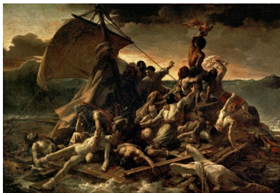
Figura 2. Théodore Géricault. La balsa de la medusa 1819. Procedencia: https://es.wikipedia.org/wiki/La_balsa_de_la_Medusa .

Hasta no hace tanto tiempo los soportes del dibujo eran considerados, casi invariablemente, bidimensionales y de naturaleza matérica. Así, los diferentes materiales constitutivos de los mismos (celulosa, lino, algodón o madera, por citar unos pocos) formaban parte inseparable de su realidad, y para analizarlos era necesario sincronizarse con ellos y tenerlos literalmente frente a los ojos. Por ejemplo, para disfrutar del bellissimo cuadro de Théodore Géricault (Fig.2), La balsa de la medusa , es preciso visitar el Museo del Louvre, subir a la planta primera y, en el Ala Denon, entrar en la sala 700. Debido a las grandísimas dos dimensiones del cuadro, su contemplación obliga a mirar hacia arriba o alejarse lo suficiente. Aunque presenta los sucesos y la acción de forma instantánea, puede entenderse -siguiendo el hilo de pensamiento que Foucault nos propuso para las Meninas (Foucault 1966, pp. 19)- como la materialización de una serie de secuencias que explican, o más bien narran, una serie de acontecimientos.