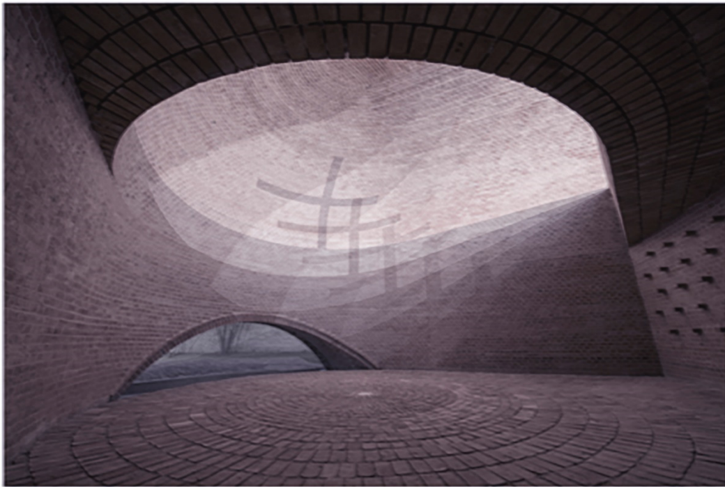
Figura 1. Superposición de varios fotogramas. Capilla de San Bernardo. Arquitecto: Nicolás Campodonico. 2015. Composición realizada por los autores con imágenes extraídas de https://www.plataformaarquitectura.cl/cl/787722/capilla-san-bernardo-nicolas-campodonico

Departamento de Expresión Gráfica, Composición y Proyectos, Universidad de Alicante