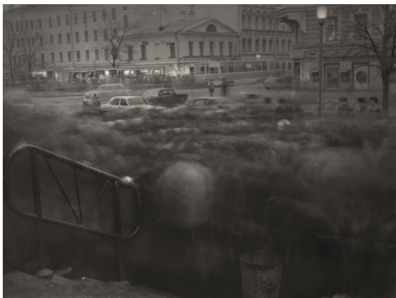
Figura 4. Alexey Titarenko. La ciudad de las sombras 1992. (Titarenko 2001)