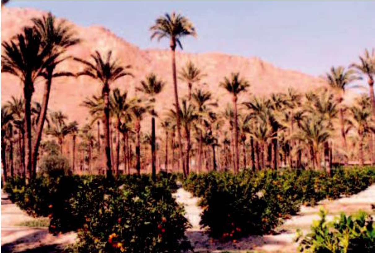
Vista del palmeral en los años 90. Plantación de cítricos.

Podemos afirmar que nos encontramos ante un sistema agrícola de explotación intensiva, cuyos paralelos hay que buscarlos en el mundo islámico y que sigue el modelo de los oasis magrebíes (Franco, 1987). El aprovechamiento del suelo es máximo, en cultivos con una estructura vertical compleja, con un estrato inferior herbáceo ocupado por cultivos de forrajeras y hortalizas, por encima del cual aparece un segundo nivel arbóreo de cultivos como el olivo o los cítricos, y sobre el que se establece, rematando el dosel, un tercer estrato ocupado por las palmeras datileras. Se trata de un singular aprovechamiento cultural de extraordinario valor paisajístico histórico y etnológico, al cual ha estado asociada una artesanía ligada a la palmera y a las cañas.