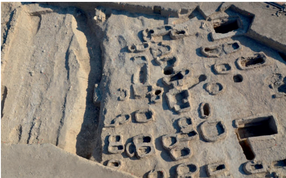
Fig. 3. Vista de la necròpolis del Hierro Antiguo de Les Casetes (sector Jovada), a Vila Joiosa (Alacant).

mica més al nord, la Solana del Castell de Xàtiva, centre vinculat a una xarxa d'intercanvis articulada pel Xúquer. Juntament amb aquests oppida destaca l'aparició d'un dens poblament de caràcter rural lligat a la intensificació de l'activitat agrícola.