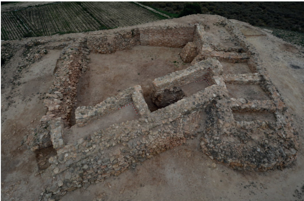
Fig. 2. El Cabezo Pequeño del Estany (Guardamar del Segura, Alacant). Fortificació del primer assentament fenici de la desembocadura del Segura, segle VIII aC.