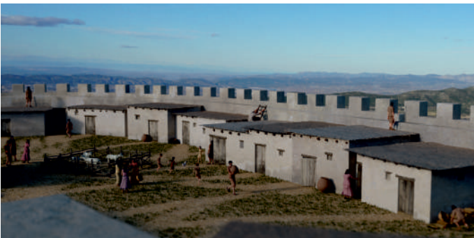
Fig. 7. Recreació del Cabeçó de Mariola (Alfafara, Alacant – Bocairent, València), segle I aC.