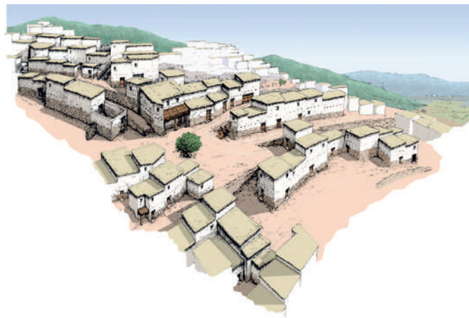
Fig.6. Recreació d'Edeta – Tossal de Sant Miquel (Llíria, València), segle III aC.

Una altra sensible diferència entre zones s'expressa en l'ordenament territorial i les seves trajectòries, ja que reflecteix estructures sociopolítiques diferents. L'àrea septentrional va consolidar grans centres urbans i estructures fortament jerarquizades de poblament al segle IV aC que van perdurar sense grans canvis durant el segle III aC. Els exemples de Kelin o Edeta (Fig. 6) mostren l'ordenament en ciutats d'al voltant de 10 ha que van dominar amplis territoris comarcals, als quals es van establir nuclis de diferent naturalesa com els ben coneguts Castellet de Bernabé o Puntal dels Llops.