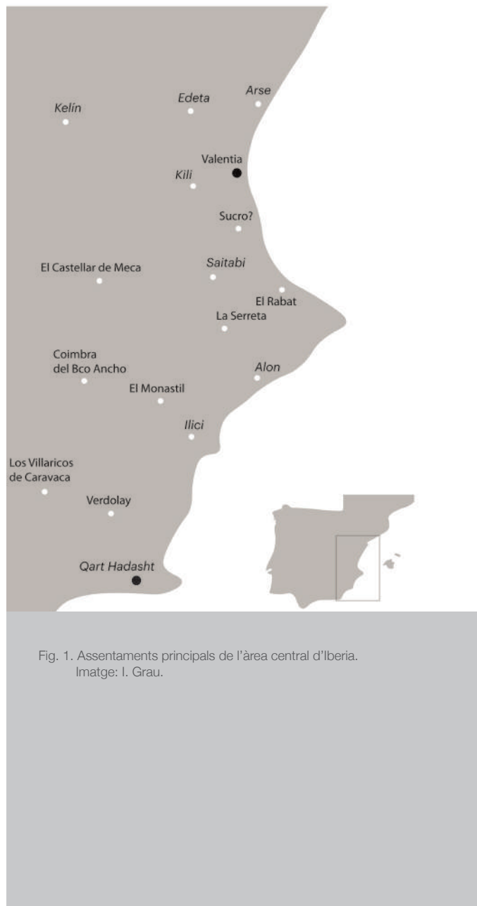
Fig. 1. Assentaments principals de l'àrea central d'Ibèria.