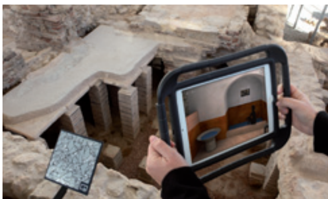
Figura 1. Vista de la guía interactiva sobre los restos arqueológicos del Museo al Aire Libre Villa romana de l'Albir

Situado en el territorium de Ilici, en el paraje de El Clot de Galvany (Elche) (MOLINA VIDAL, 2015), junto a un humedal de tierras pobres, presentamos una granja