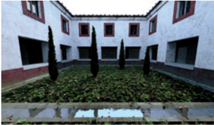
Figura 5. Vista del modelo 3D creado para la visualización de la villa romana de Rufio