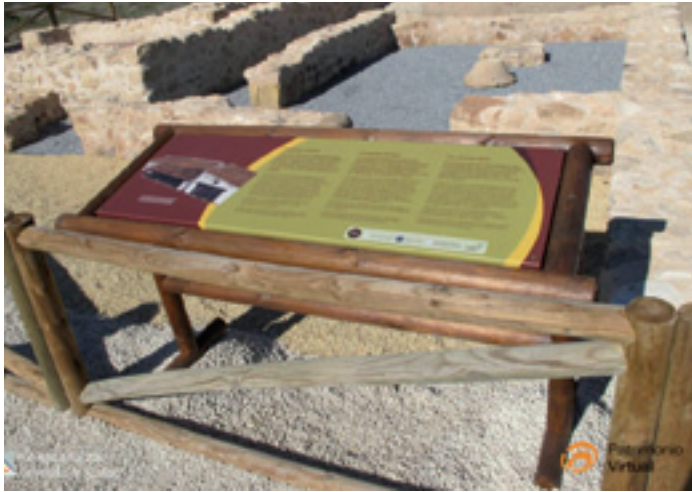
Figura 2. Vista de uno de los paneles con infografía 3D del Clot de Galvany

romana (ss. I-III d.C.), que tras su abandono en el s. XVII volvió a ser ocupada en forma de ermita. Tras llevar a cabo su excavación, estudio, consolidación y puesta en valor, se hizo necesario la instalación de una señalética con infografías 3D que recreasen los dos momentos de uso del sitio arqueológico.