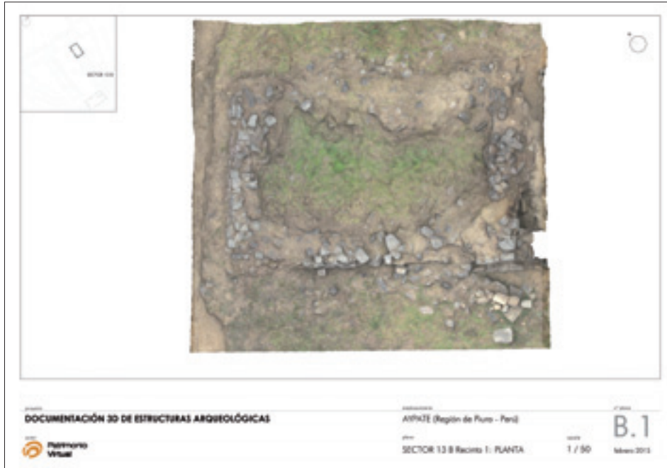
Figura 3. Resultado final de ortoimagen obtenida mediante fotogrametría digital tras los trabajos llevados a cabo en Aypate

fue fundamental para conocer y analizar las distintas intervenciones de consolidación que se habían realizado y proyectar posteriores intervenciones arqueológicas. Algunos de los modelos 3D pueden visualizarse desde el perfil de Patrimonio Virtual en el repositorio Sketchfab, permitiendo al público disfrutar y conocer el potencial que encierra este gran yacimiento arqueológico (figura 3).