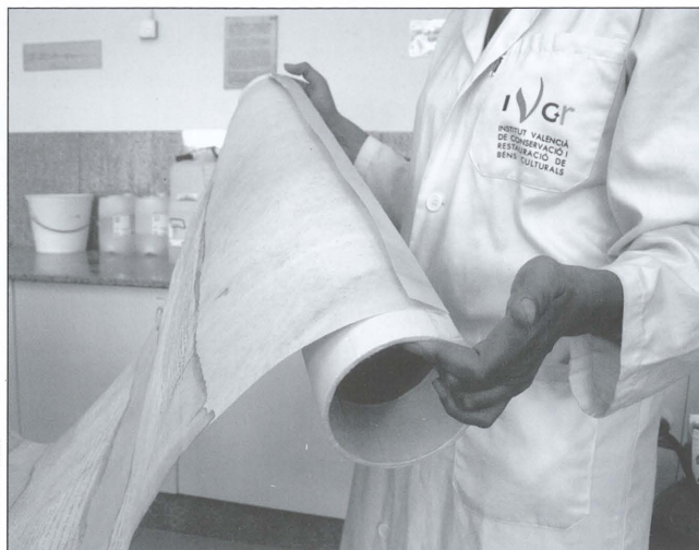
Patricia Real Machado

Debido a las dimensiones del conjunto de pergaminos se optó por un sistema final de montaje en tubo, que facilita su almacenamiento enrollado, a la vez que su exposición.