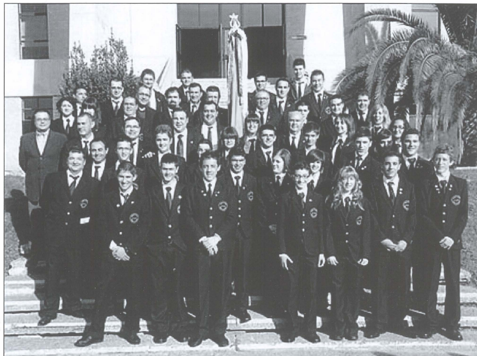
Agrupación Musical La Nova.

- Premios: Segundo Premio en el Certamen de la Diputación Provincial de Alicante en 1979; Primer Premio en el Certamen de la Diputación Provincial de Alicante en 1994; Primer Premio en el Certamen Internacional de Bandas de Música «Ciudad de Valencia» y Primer Premio y Mención de Honor en el mismo certamen anterior en 2001.