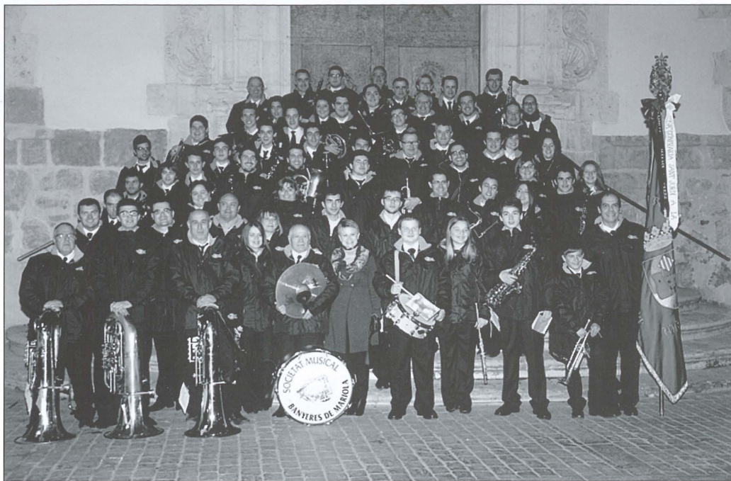
Societat Musical Banyeres de Mariola

y puedan alcanzar el nivel musical necesario para poder después tocar en la banda. Este instrumental que atesoran las bandas es en cifras económicas muy alto, realmente toda una inversión para la ciudadanía.