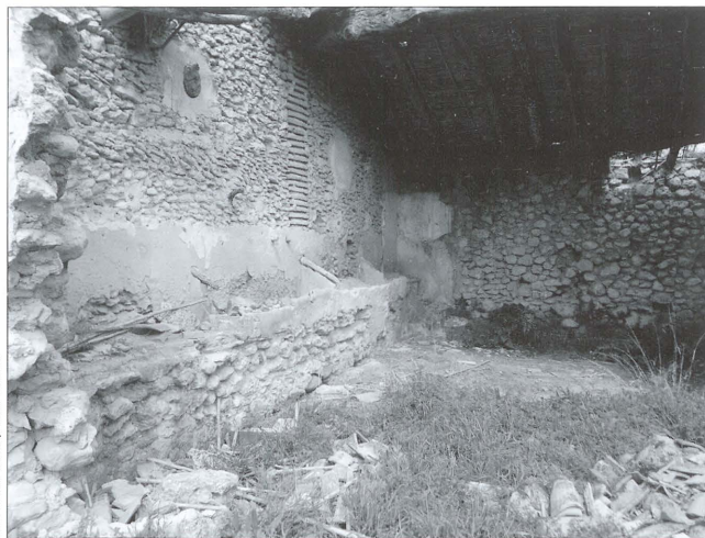
Pessebres a les quadres de la Venta Vella (Beneixama)

Les parets de la quadra no estaven lluides, ni tampoc hi havia un piso d'algeps. En terra hi havia un eixut o jaç de palla, pallocs o fenàs, que de tant en tant es treia junt al fem i s'aprofitava com a adob.