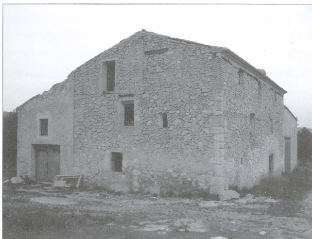
Cases del Campet (el Camp de Mirra). S'observen diverses etapes constructives.

Als segles XVIII i XIX es van rompent a poc a poc totes aquestes terres i es dediquen al conreu de l'olivera i la vinya. L'increment de la producció agrícola fa necessari reformar els masos i dotar-los d'espais més amplis per a emmagatzemar les collites, així com d'almàsseres i sobretot cellers més grans. A més a més, en alguns casos es tira la teulada i es fa una planta més. Açò permet disposar d'un habitatge en la primera planta per als senyors, que aniran al mas a passar l'estiu i aprofitaran la seua estada per a controlar els