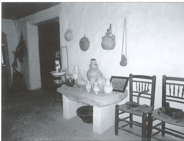
Canterer o banc de cànters al porxe de la Casa de les Monges (el Camp de Mirra)

En algunes ocasions el mas té una porta que permet accedir a l'edifici principal, però també és habitual accedir-hi des del pati clos o corral. La primera estança que ens trobem en travessar la porta se sol anomenar porxe a la nostra comarca. Es tracta d'un espai ample que pot adoptar múltiples funcions 6 . Hi sol estar present el banc dels cànters: un llosa de pedra amb una canaleta al voltant