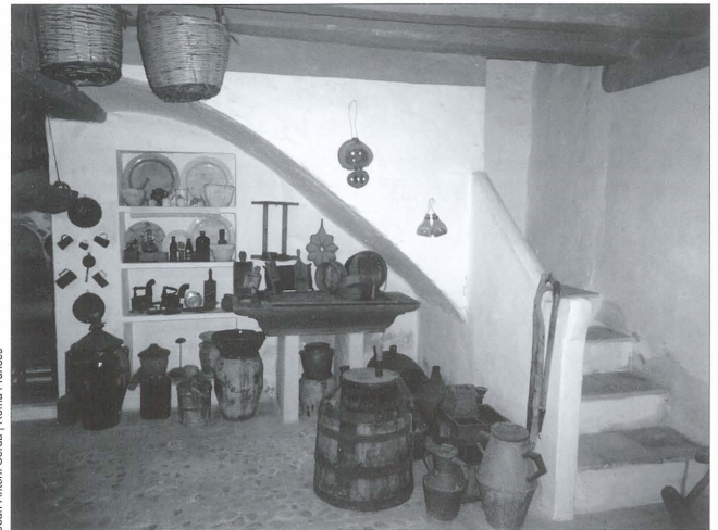
Recreació d'un pastador a la Casa de les Monges (el Camp de Mirra). Normalment solien estar baix l'escala però tancats amb una citara.

Una altra estança a la qual també solia accedir-se des de la cuina era el pastador. Es tracta d'un xicotet rebost on s'emmagatzemava el quemenjar: oli, farina, llegums, arròs... També hi havia la pastera: un recipient de fusta recolzat sobre dos pilarets de rajola on es pastava el pa. Era freqüent que aquesta dependència se situara baix de les escales que accedeixen a la primera planta.