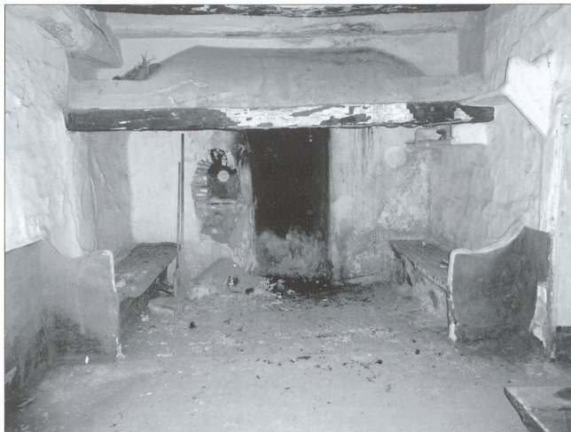
Coveta de campana amb forn i bancs d'obra a un mas de la Canyada

La cuina era un espai prou gran destinat a cuinar i fer la vida. A la nostra comarca es caracteritza per la presència d'una llar o coveta en forma de campana, sostinguda per una biga que va de paret a paret. El foc es feia a ras de terra, sobre un paviment de rajola i arrimat a la paret, la qual sempre presenta un rebaix de forma semicircular anomenat fumerol . A un costat hi ha el forn, on es coïa el pa, un parell de vegades per setmana. El forn es construïa amb una volta de rajola i quedava emmarcat entre parets que podien eixir fora del mas o quedar dins d'una altra habitació. L'espai entre la volta i les parets s'omplia d'arena que ajudava a mantenir la calor. La boca del forn es cobria amb una portella metàl·lica. Al costat de la llar és habitual trobar dos bancs d'obra, que es recobrien amb unes estores de llata. A les parets hi ha també lleixes d'obra on deixar olles i eines de cuina. A l'estança també trobem un armariet enclavat a la paret i tancat amb portelles de fusta per a plats, gots i la resta de la curta vaixela del mas. El parament de l'estança es completava amb alguna cadira baixeta, que solien usar les dones per a cuinar i una tauleta per a menjar tota la família.