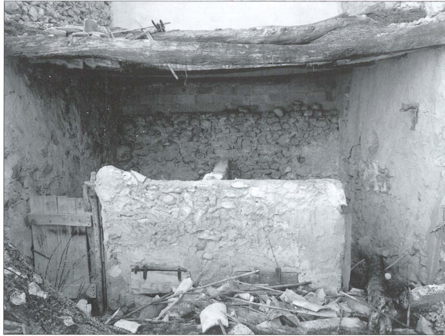
Porqueres amb portelles per a abocar els albeuratges

amb una tanca d'un metre d'alt i amb una porteta de fusta. Dins hi havia alguna menjadora de fusta en terra per a abocar els albeuratges 7 . No obstant això, hem pogut veure una solució enginyosa per a no haver d'entrar a la porquera a l'hora de posar el quemenjar als porcs. Es tracta d'un llibrell obrat a terra, al qual es poden abocar els albeuratges des de fora, ja que hi havia un forat a la paret tancat amb una portella. Com en el cas de les quadres, a terra també es posaven eixuts que es canviaven de tant en tant.