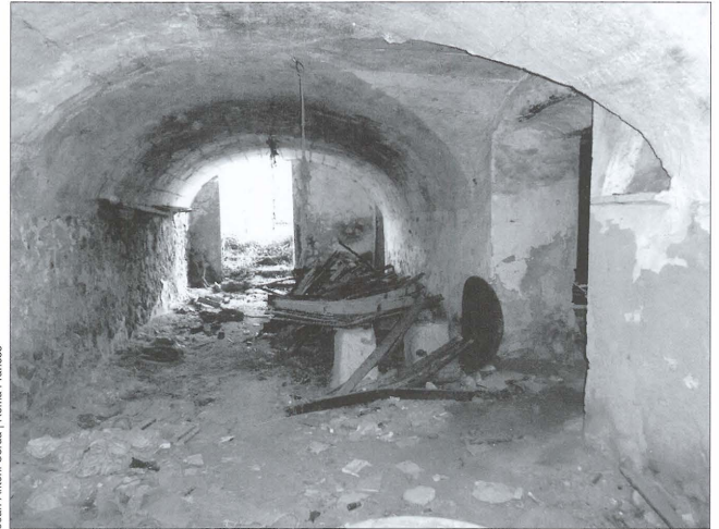
Antic celler amb volta de canó rebaixat a les Cases de Mestre (Beneixama). A la dreta es pot observar la bancada per a botes, pipes o tonells.

El raïm es carregava en carros i arribats al celler s'abocava a un espai enrajolat. Generalment es xapigava allí mateix i el most