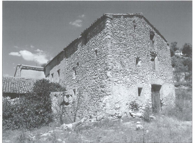
Perspectiva del Mas de l'Hedra (Banyeres de Mariola). Es tracta d'un mas del segle XVIII amb tres plantes i coberta a dues aigües. A l'esquerra, corral i zona de quadres.

Pel que fa al nombre i orientació de les crugies el més habitual és trobar dues navades paral·leles a la façana, especialment a les cases de finals del segle XVIII i del XIX. No obstant això, també apareixen exemples interessants amb navades perpendiculars a la façana.