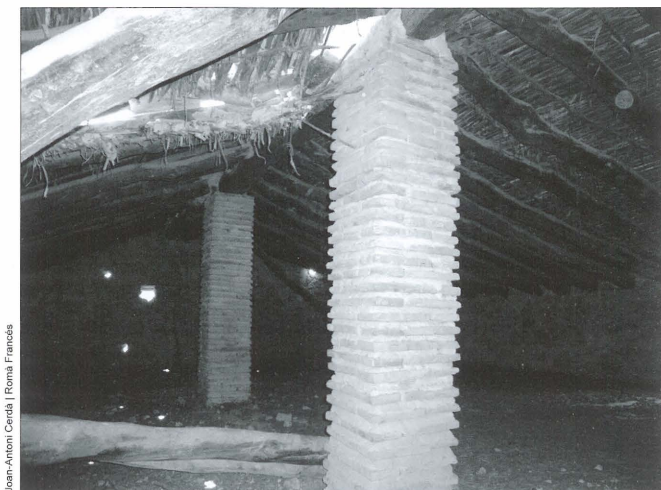
Terrat amb pilars de rajola a un mas de Banyeres de Mariola

A la nostra comarca s'anomena terrat la cambra gran que ocupa l'últim pis de la casa, destinada a guardar collites que necessiten assecar-se com cereals, ametles, anous, carabasses, farratge per als animals (alfals, canyots o palla) o coses de poc ús. Als terrats es deixaven en unes finestres rectangulars de gran mida per a que entrara l'aire i el sol. En estes finestres es posava una carrutxa per a pujar totes aquestes coses. L'existència de terrat també brindava una major protecció davant les inclemències del temps, com la pluja (goteres) o les temperatures extremes.