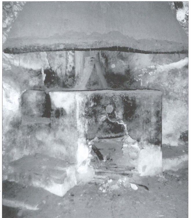
Instal·lació per a fer les arropades amb caldera incorporada a la Venta Vella (Beneixama)

anava caient al cup , una mena de bassa xicoteta, rectangular o quadrada que hi havia al costat. La brisa 8 es posava en esportins en la premsa, per acabar de traure tot el suc. Aquest procés s'anomenava repermut , alteració fonètica de repremut . Pel que fa a les premses, les més antigues eren de fusta i a començaments del segle XX es renoven per les de ferro, que es fabricaven a Alcoi a les siderúrgies d'Aznar i Rodes. Quan el vi s'elaborava en