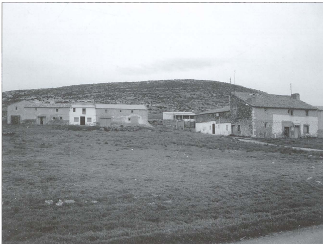
Agrupació de cases al Portell (la Canyada)

Per tal d'entendre la tipologia de la casa rural tradicional és necessari conèixer el context econòmic, així com les circumstàncies històriques del moment en que es van alçar aquestes edificacions. La segona meitat del segle XIII i tot el segle XIV són un moment clau pel que fa al poblament i a l'estructura territorial de la nostra comarca, ja que es produeix un canvi històric que trenca amb la situació dels segles anteriors. En aquest període té lloc la conquesta de la Vall pel rei Jaume I i la seua incorporació al regne