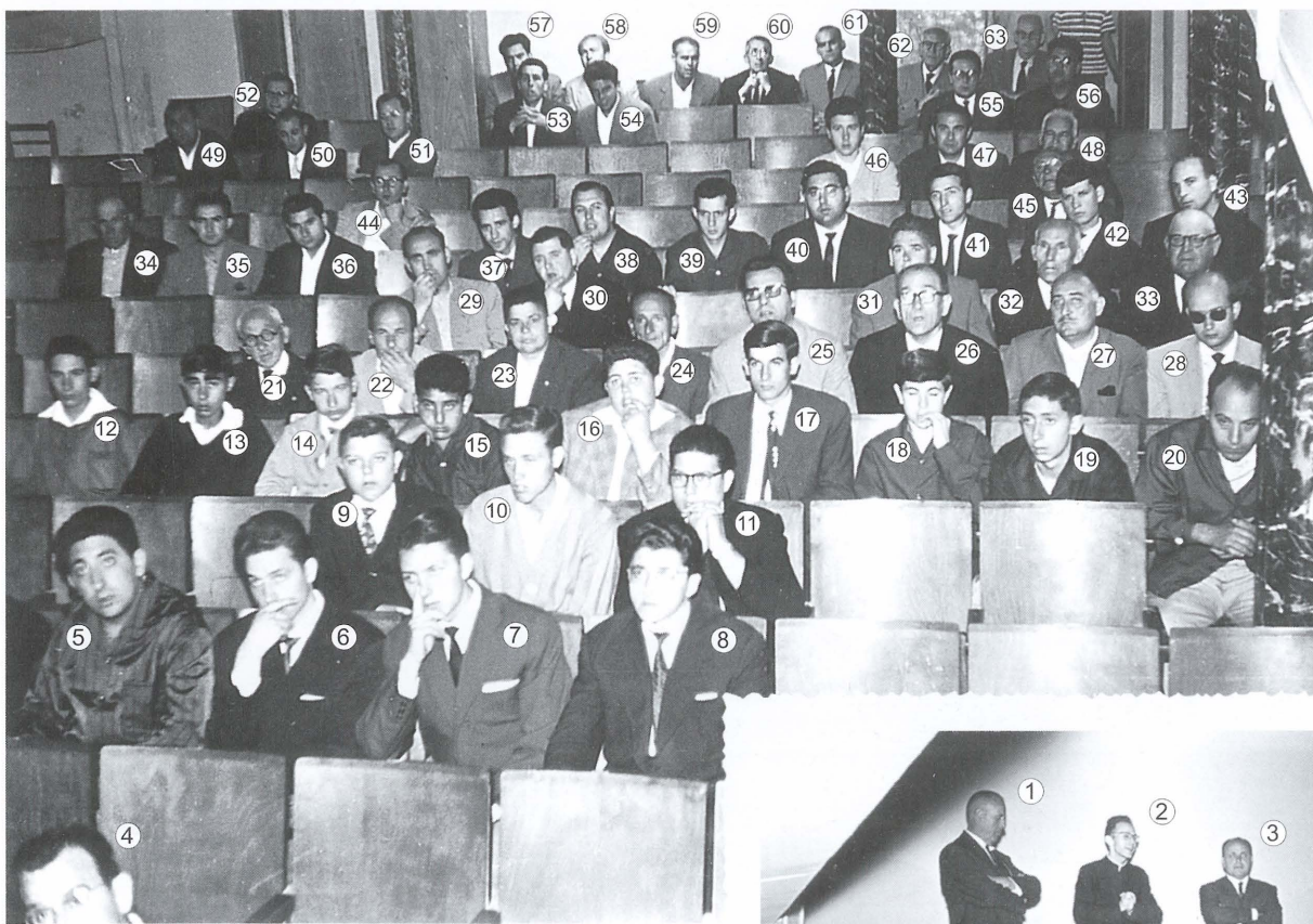
Acte preliminar de la fundació de l'Adoració Nocturna, celebrat en el Teatre Beneficència en 1963.