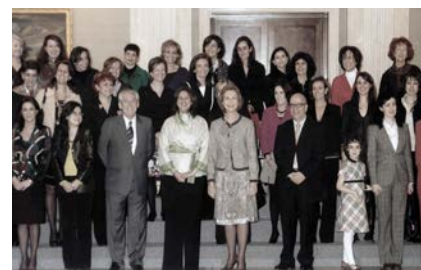
Figura 4. Audiencia a una representación de las mujeres participantes en la exposición “España (f.) nosotras, las ciudades”, que se desarrolló en Venecia en 2006.

18 Henry Vicente (ed.), Arquitecturas desplazadas, arquitecturas del exilio español , Madrid: Ministerio de Vivienda, 2007.