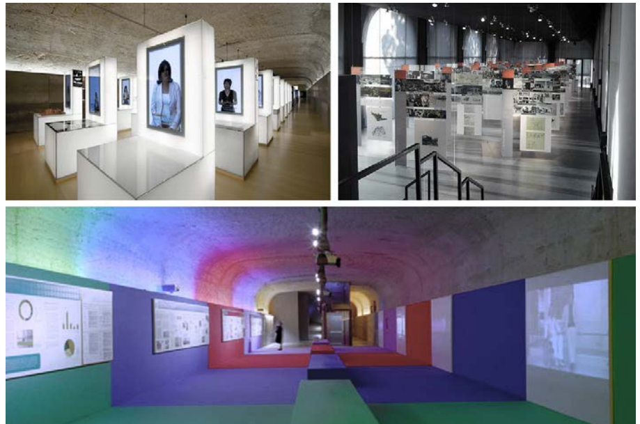
Figura 5. “Exposiciones España, [f.]. Nosotras las Ciudades”; “Arquitecturas desplazadas, arquitecturas del exilio español” (superior) y “Habitar el presente. Vivienda en España: sociedad, ciudad, tecnología y recursos” (inferior). Disponibles en https://www.mitma.gob.es/el-ministerio/sala-de-prensa/noticias/mar-01122020-120?page=1305, http://www.cbestudio.com/proyectos/arquitecturas-desplazadas-2 y http://www.grupoink.com/habitar-el-presente/. (Última consulta noviembre 2021)

Durante la Presidencia Española de la Unión Europea, como Directora de la Unidad de Mujeres y Ciencia y representante del Gobierno de España en el Grupo de Helsinki sobre Género en la Investigación de la Comisión Europea (2009-2014), lideró el exitoso proceso que desembocó en la amplia integración de las dimensiones de género y la igualdad entre mujeres y hombres en el Programa Marco Europeo de Investigación e Innovación Horizonte 2020. Asimismo en el sistema español, a través de la disposición decimotercera de la Ley 14/2011, de 1 de junio, de la Ciencia, la Tecnología y la Innovación, Implantación de la perspectiva de género.