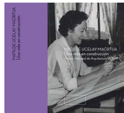
Figura 6. Fotomontaje portada Matilde Ucelay. Una vida en construcción .