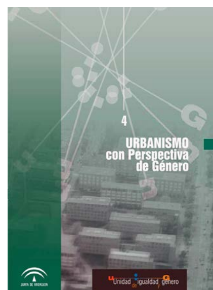
Figura 2. Sánchez de Madariaga, Inés. Urbanismo con perspectiva de género . Sevilla: Fondo Social Europeo y Junta de Andalucía, 2004.

10 Inés Sánchez de Madariaga, Urbanismo con perspectiva de género . Sevilla: Fondo Social Europeo y Junta de Andalucía, 2004.