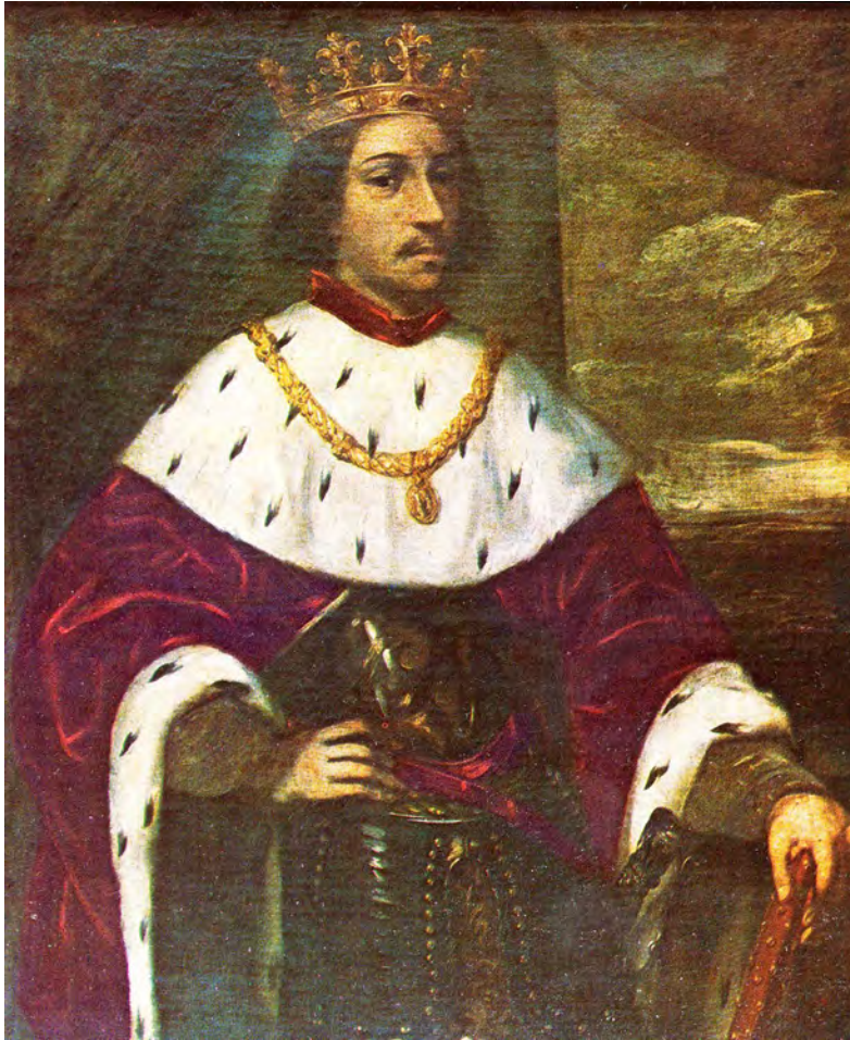
Retrato idealizado del rey Juan II de Aragón. Pintura anónima del s. XVII. Palau de la Generalitat, Valencia.