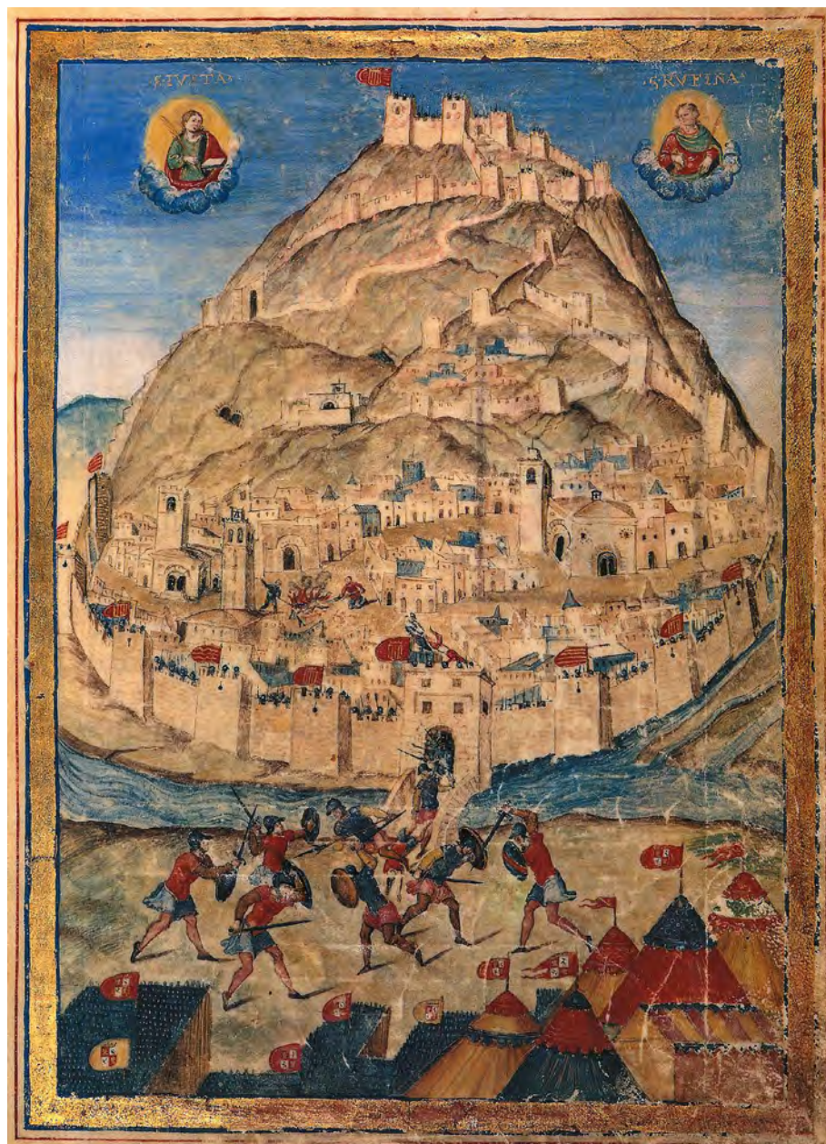
Escena de la Guerra de dos Pedros (1356-1369): la ciudad de Orihuela asediada por las tropas castellanas. Cartulario Oriolano, documento del s. XVI, conservado en el Archivo Histórico Nacional.