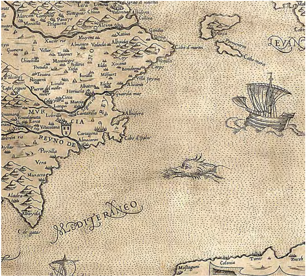
Guardamar en el mapa de la península ibérica de Paulo di Fornali Veronese (1565)