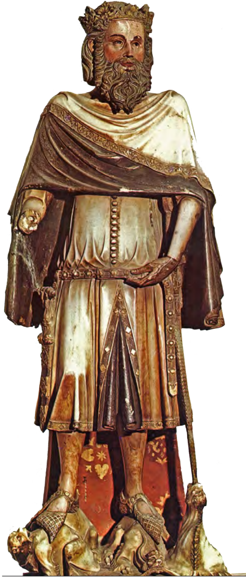
Escultura de alabastro de Jaume Casal, conservada en la catedral de Girona, y conocida como “Sant Carlemany” correspondiente al rey Pedro IV de Aragón “el Ceremonioso”.