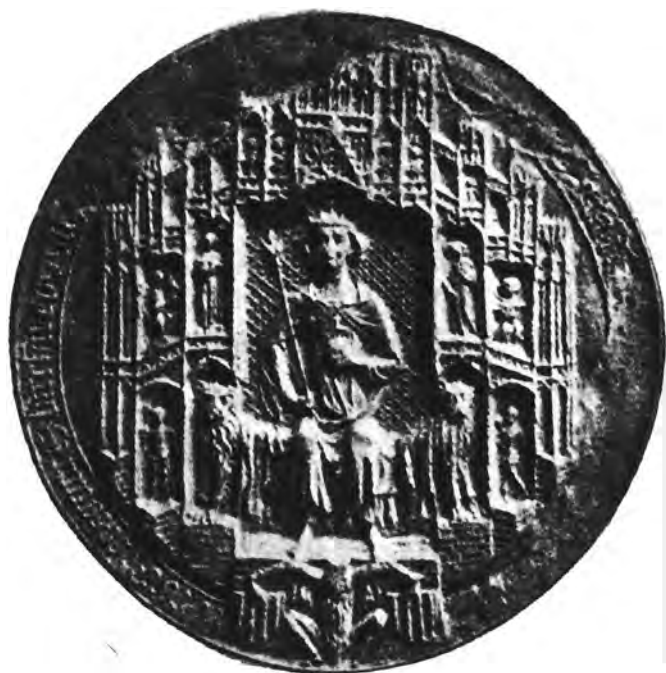
Sello del rey Juan I de Aragón.