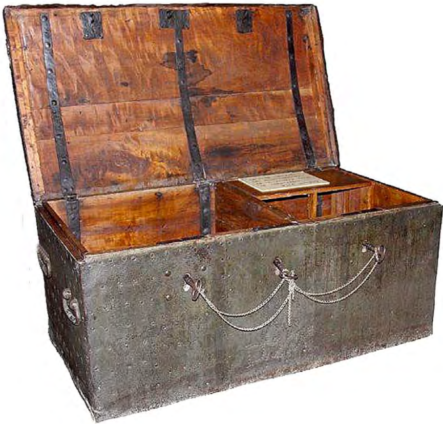
Arca de caudales del Consell de Guardamar. Siglos XVI-XVIII. (imagen cedida por el Museo Arqueológico de Guardamar del Segura)