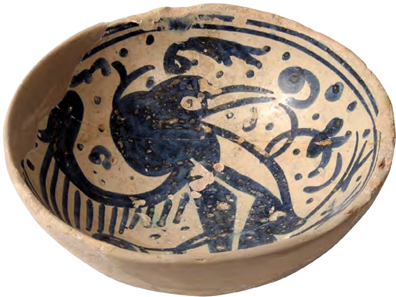
Cerámica tardomedieval encontrada en el Castell de Guardamar