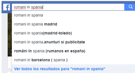
Figura 2. Buscador de Facebook.