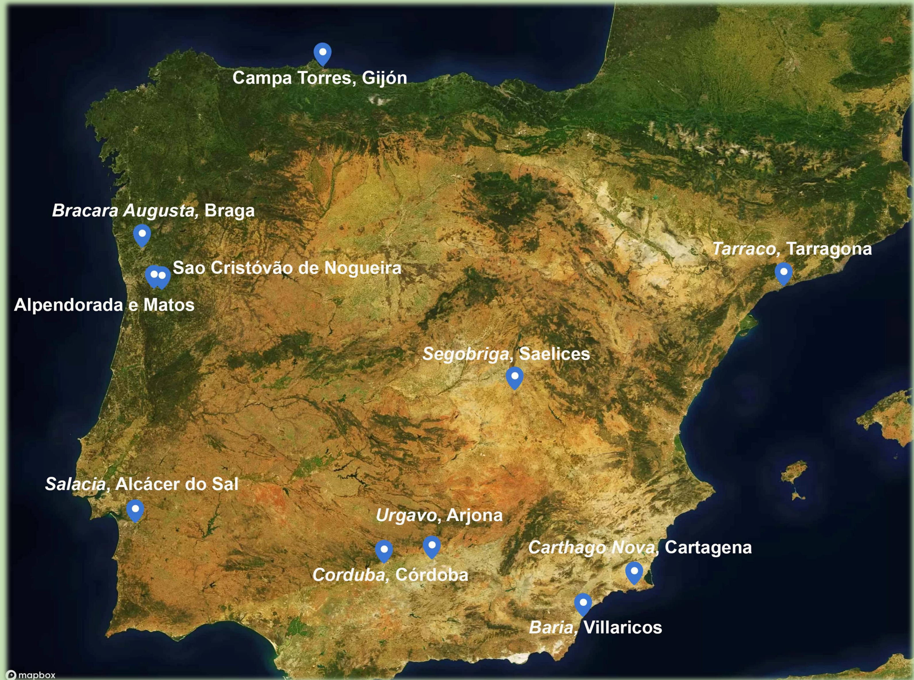
Mapa con la distribución de los testimonios de culto en vida a Augusto en Hispania .

Se trata de epígrafes en los que aparece el término sacrum junto a la titulación del emperador en vida, así como dedicaciones a su genius y numen fechables en época augustea.