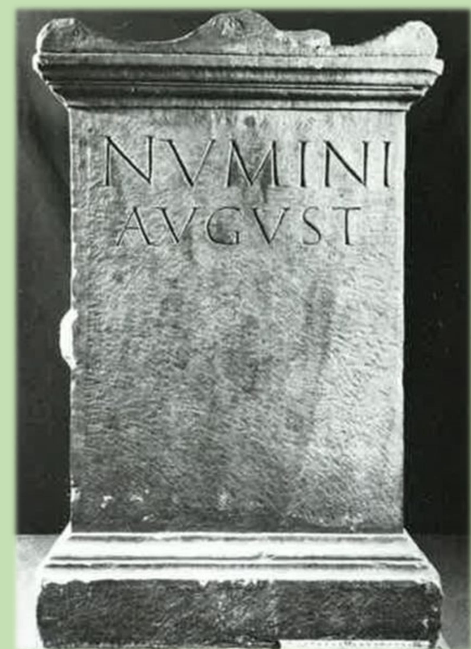
CIL II 2 /14, 851. Tarraco.