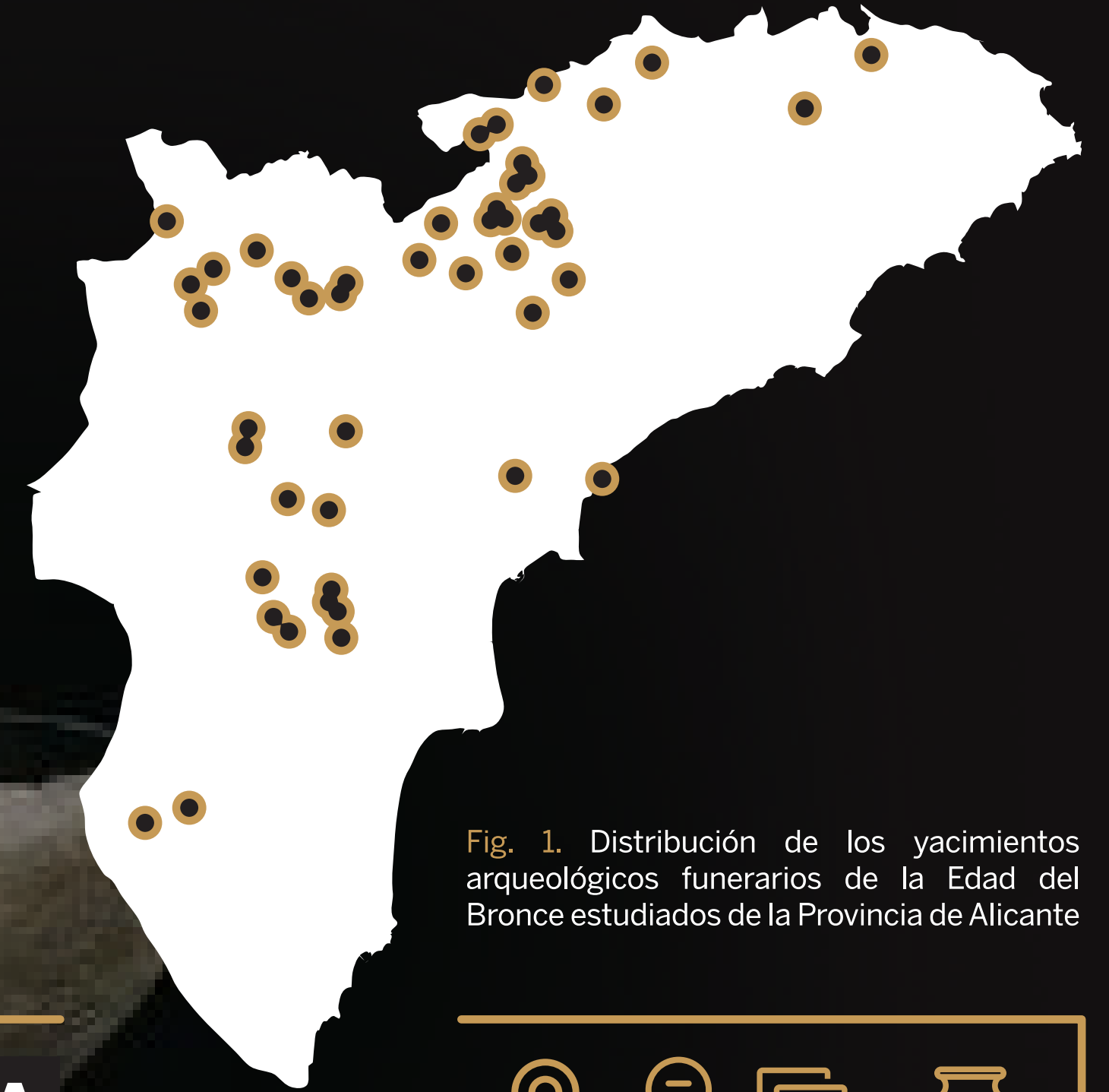
Fig. 1. Distribución de los yacimientos arqueológicos funerarios de la Edad del Bronce estudiados de la Provincia de Alicante

Los avances en las investigaciones, a parte del necesario proceso de sintetización e interpretación, se reflejan con adecuada fidelidad en la generación de los contenidos expuestos. Las áreas temáticas principalmente tratan la tecnología –metalurgia–, la expansión del poblamiento y el mundo funerario como exponente de la transformación social y cultural.