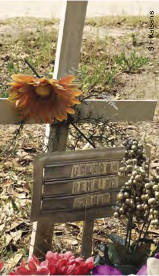
La tumba de un migrante desconocido en el cementerio del Sagrado Corazón, en el condado de Brooks.

Se están llevando a cabo cuantiosos esfuerzos gubernamentales y no gubernamentales para mejorar la búsqueda y recuperación, los procesos de identificación y de comunicación y repatriación. Por ejemplo, algunas jurisdicciones han empezado a enviar los restos humanos sin identificar y las muestras de ADN de “referencia familiar” a un laboratorio privado de ADN que no exige que las muestras se tomen en presencia de las fuerzas de seguridad, lo que ha contribuido a la identificación