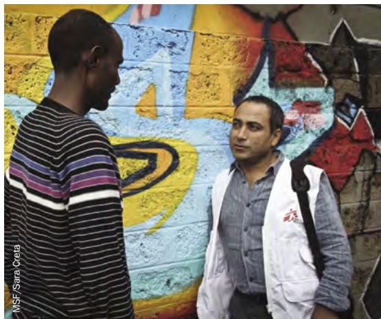
Un mediador cultural de MSF trabajando con personas desplazadas en Italia.

Algunos mediadores culturales asisten a los facultativos o al personal de los servicios de salud mental durante las consultas individuales, o trabajan con supervivientes de la tortura y mujeres víctimas de trata. Otros trabajan con entidades jurídicas o de seguridad, proporcionándoles información y servicios de traducción durante las vistas orales. Traducen tanto las palabras como los conceptos entre los clientes y los proveedores de servicios, garantizando que se entienda al cliente y que así pueda acceder a la atención y el apoyo que necesita.