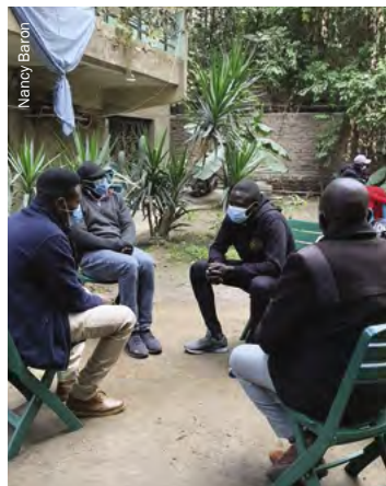
Formación de nuevos trabajadores de los PSTIC durante la pandemia de la COVID-19, El Cairo.

El apoyo social a través de la familia, los amigos o la comunidad es la piedra angular de cada plan de acción individualizado. Los trabajadores de los PSTIC ayudan a las personas a encontrar un sistema de apoyo seguro y a desarrollar las capacidades y la responsabilidad de dicho sistema. No se rechaza a nadie que