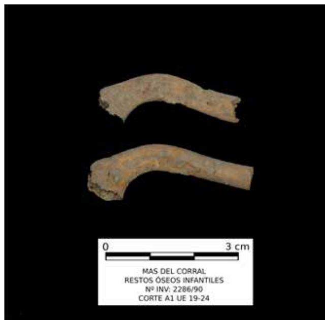
Figura 4. Fragmentos de dos clavículas derechas infantiles procedentes del sedimento de la UE.19-24.

individuo muy grácil. Fragmentos craneales de calota. Fragmento de escama temporal. Fragmento de mandíbula izquierda, alveolos: 73 (roto), 74 y 75. Una costilla derecha incompleta. Fragmento proximal del cúbito izquierdo. Radio derecho casi completo; izquierdo solo fragmento proximal. Fémur derecho casi completo, izquierdo incompleto. Tibia derecha casi completa, izquierda incompleta. Fragmentos de ambos peronés (fig. 5).