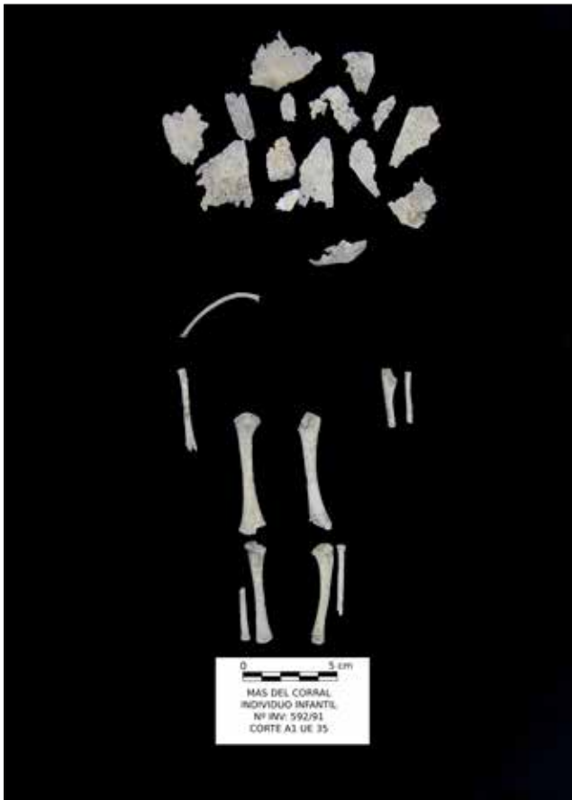
Figura 5. Restos conservados del enterramiento MC.V.91.A1.UE.35.