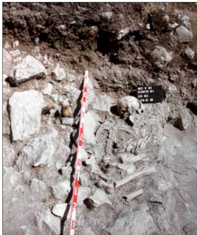
Figura 2. Enterramiento MC.V.91. Corte B1. UE.62, correspondiente con un hombre adulto.

Si ya Julio Trelis indicó la inexistencia de casos similares a los enterramientos de perinatales en el área del Bronce Valenciano, cabe señalar que en los estudios osteoarqueológicos realizados en los últimos años en el Cabezo Redondo –Villena–, quizás el yacimiento más relevante del territorio valenciano, sí se han recuperado restos de perinatales, en ocasiones depositados de forma individual, mientras que en otras aparecen compartiendo espacio con otros esquele-