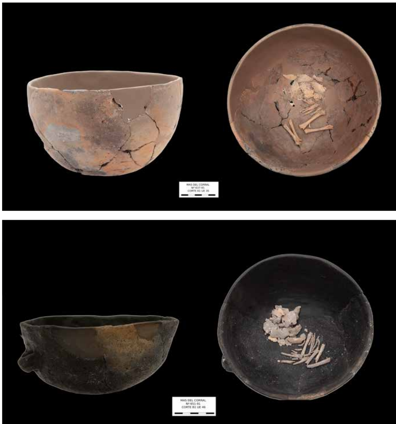
Figura. 3. Cuencos conservados en el Museu Arqueològic d'Alcoi. Reubicación de los restos óseos (Fotografía Ivan Guerola. Edición Pedro Ramón Baraza. Museu Arqueològic d'Alcoi).

a partir de las evidencias conservadas. Una vez obtenidas las longitudes se han seguido las propuestas de Jeanty et al. (1985), Fazekas y Kósa (1978) y las fórmulas de Scheuer et al. , publicadas en 1980 (Scheuer y Black, 2000) para la obtención de las edades aproximadas. Igualmente hemos utilizado las fórmulas de Balthazard y Dervieux (1921) para la aproximación a la talla.