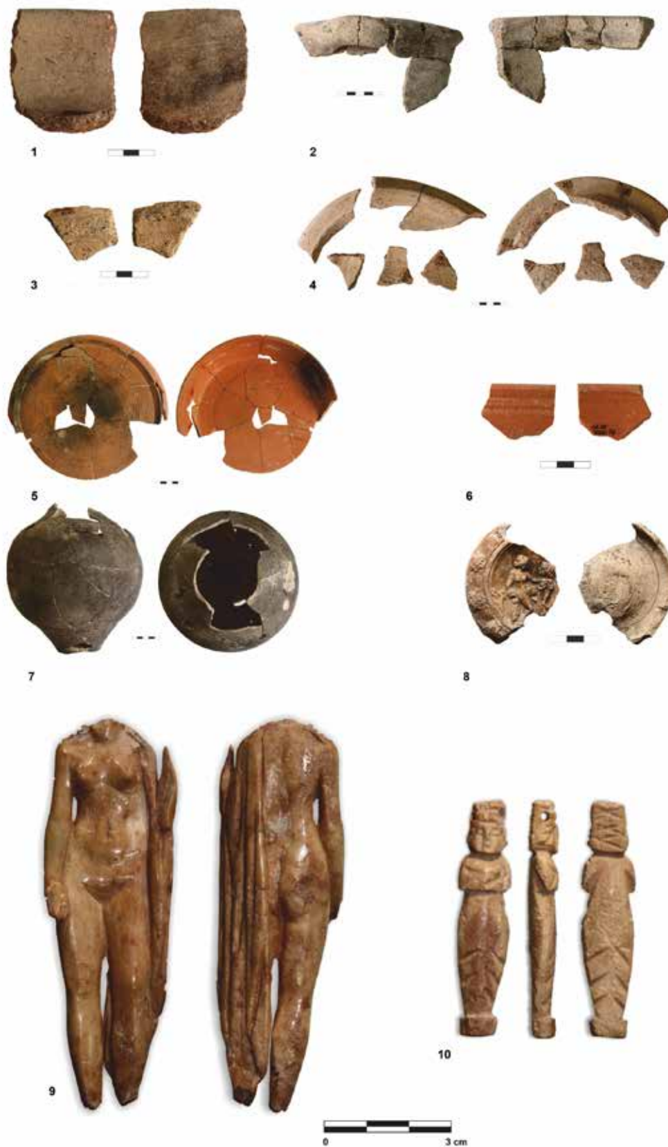
FIGURA 5. Lámina con algunos ejemplares de materiales islámicos procedentes del contexto de época islámica detectado en el sector 4F (n.º 1-4). Estas producciones diagnósticas ocupan un porcentaje reducido si lo comparamos con el abundante material antiguo en deposición secundaria que lo acompaña (n.º 5-10), resultado sin duda de la continua transformación, nivelación y movimiento de tierras efectuadas durante la construcción de la última trama «urbana» en época altomedieval.