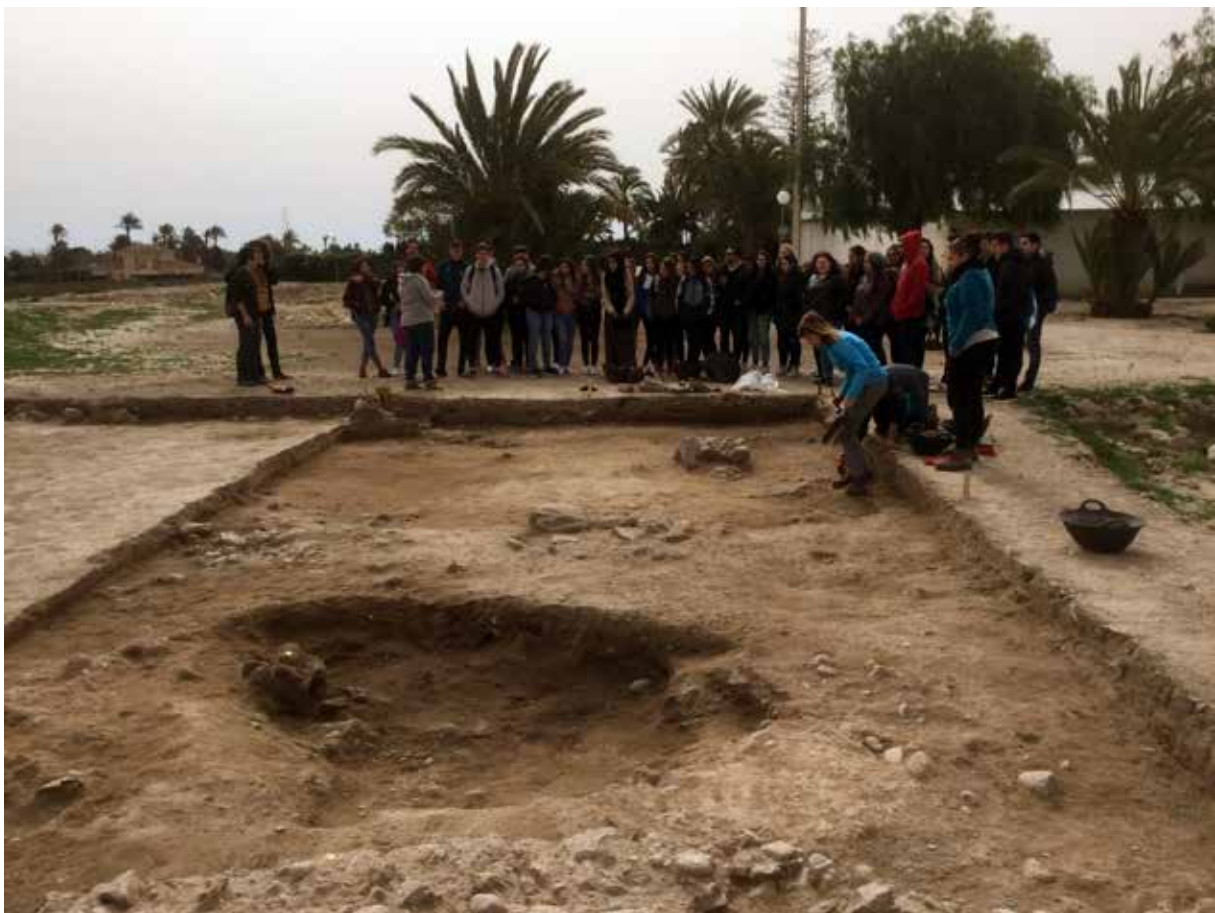
FIGURA 2. Vista de los trabajos de apertura y excavación de los primeros niveles detectados en el corte practicado en el sector 4F en 2017.