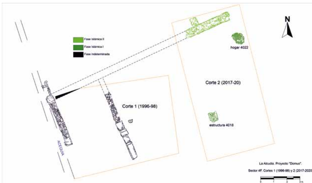
FIGURA 4. Planta donde se aprecian las estructuras documentadas en el corte 1 del sector 4F, abierto en 1996 al oeste de nuestra intervención, y que muestra algunas estructuras descontextualizadas pero que, por cota, orientación y técnica constructiva, podrían corresponder a la fase islámica documentada en nuestra intervención (corte 2).

basureros, así como restos de construcciones de carácter doméstico, como es el caso del hogar 4022 o la estructura exenta 4018 (figs. 3 y 4). Los materiales cerámicos en ellos hallados se deben situar ya claramente en época islámica, tal y como se desprende de un repertorio donde destacan formas típicas de contextos islámicos tempranos, como son las marmitas de base plana o las tapaderas, a mano o a torno con la característica pasta amarillenta bizcochada con desgrasante medio. Estas piezas, que solo ocupan un 6 % del total del contexto, vienen acompañadas de un abundante repertorio residual, incluyendo piezas tan peculiares como un ídolo de carácter orientalizante o una venus tallada en hueso de época romana, así como formas cerámicas romanas descontextualizadas de diferente producción (siglos I-III d. n. e.), destacando sobremanera las formas de cocina africana (cazuelas y tapaderas), las terra sigillatas africanas o las ollas y jarros de pasta reductora (fig. 5). Parece, por tanto, plausible defender que el asentamiento mantuvo su ocupación permanente a lo largo del siglo VIII d. n. e. y quizás habría que esperar a la siguiente centuria para asistir a su progresivo abandono (Tendero et al. , e. p.).