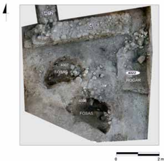
FIGURA 3. Ortofotografía del nivel de uso islámico detectado en el sector excavado, donde se aprecian algunas estructuras murarias que probablemente definieron un espacio doméstico con estructuras de combustión y basureros.

Asociados a estos niveles islámicos encontramos los primeros restos constructivos localizados cerca del perfil septentrional del área abierta (fig. 3). Se trata de los muros 4006 y 4012, relacionados entre sí, aunque de difícil interpretación arquitectónica en tanto en cuanto quedan dispuestos de forma excesivamente excéntrica respecto a la superficie del corte. No obstante, es de subrayar algunos aspectos formales de ambos que permiten inferir cuestiones de mucho interés respecto al horizonte en el que se enmarcan.