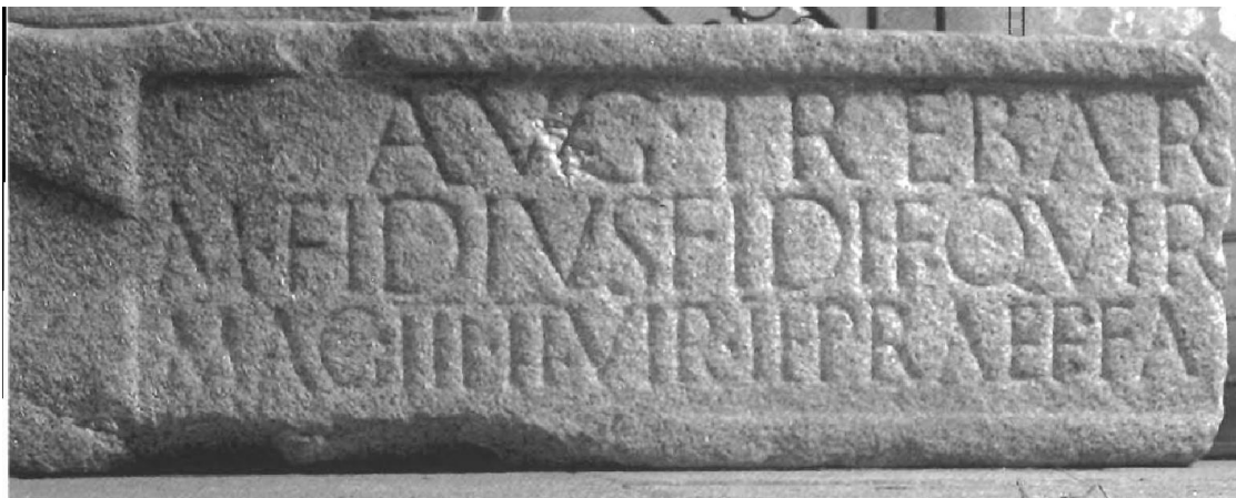
Fig. 1. Dedicación a Trebaruna en Capera (Cerrillo, 2006).