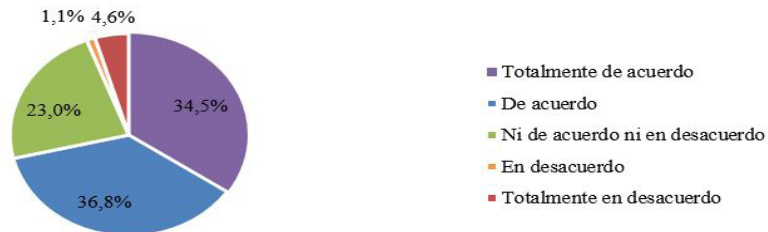
Tabla 3. Labor del profesorado

Respecto a la adquisición de competencias curriculares, las valoraciones medias recogidas en la tabla 4 indican que el alumnado ha percibido una adquisición significativa gracias al proyecto de las ocho competencias medidas.