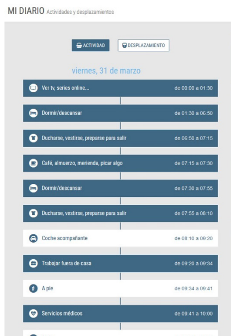
Fig. 2 Capturas de pantalla de la aplicación web utilizada para caracterizar la movilidad