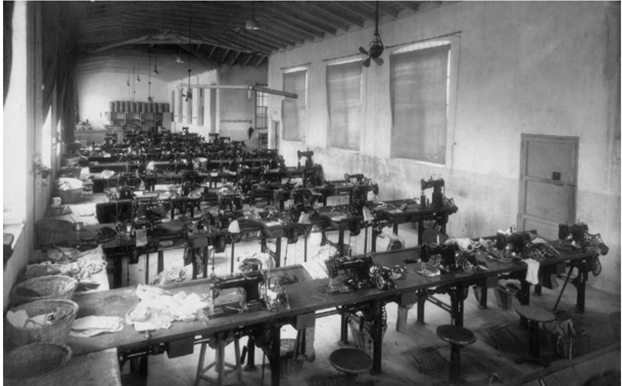
Figura 11 Sección de aparado de la fábrica Luvi. Año 1935.

Estas tres fábricas, agrupadas en dirección hacia Elda, componían un entorno fabril importante, nítidamente separado del núcleo histórico, aunque relativamente cercano, a la manera de polígono industrial; desde mediados de los años veinte su horario de trabajo ya marcaba la vida cotidiana de la villa y los momentos de entrada y salida a las fábricas eran en los días laborales —entonces todos menos el domingo— la hora punta de la agitación humana en las calles de Petrer.