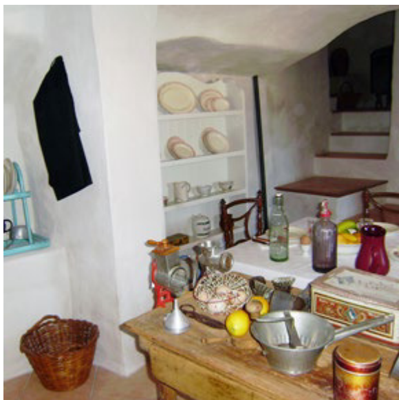
Figura 4 Interior de las casas-cueva de la muralla tras su musealización en 2009.