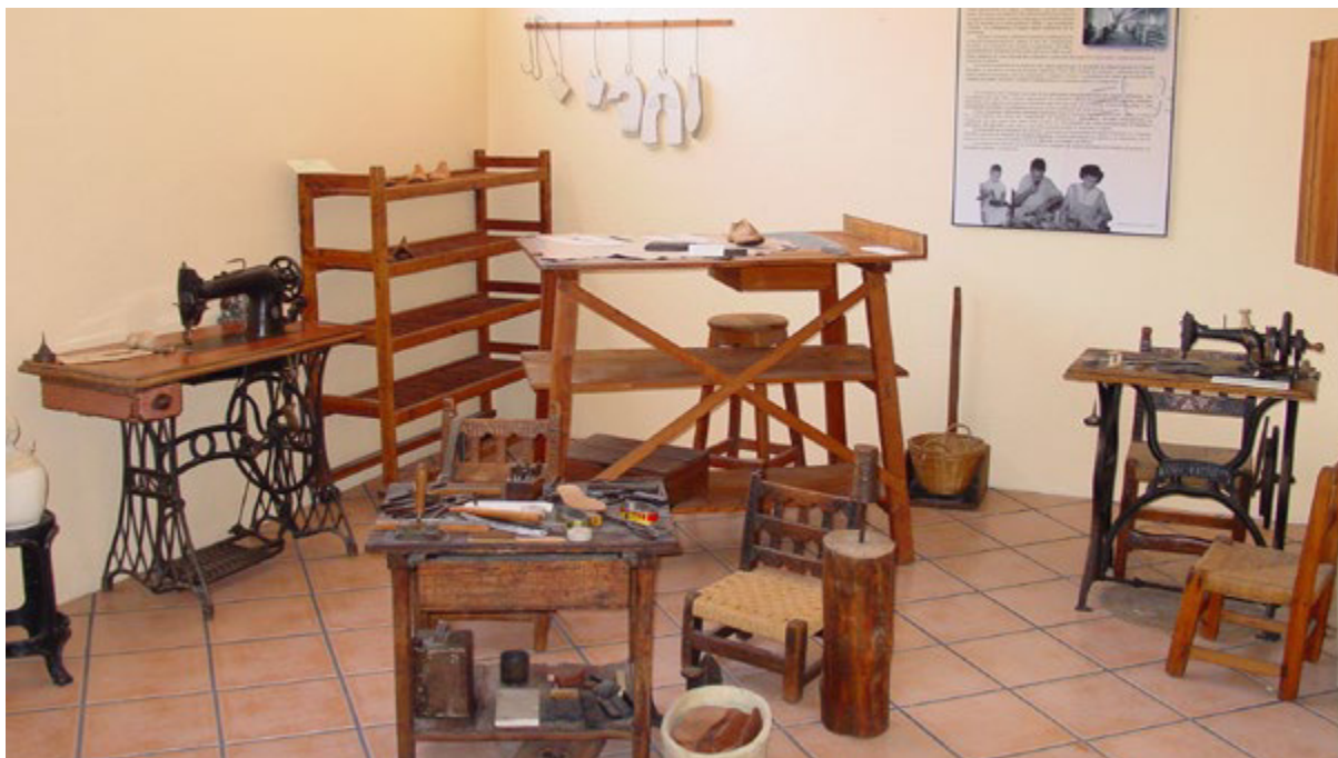
Figura 13. Recreación de taller artesanal de calzado en el Museo Dámaso Navarro.

estos cupos no siempre se conseguían –Payá (1998) habla de suministros de suela inferiores en ocasiones el 3,6% del cupo base establecido-. En unos años en que las ventas del calzado sencillo estaban aseguradas porque apenas se disponía de casi nada, se recurría al mercado negro, dado que algunas empresas revendían su propio cupo, lo que les resultaba a veces más rentable que producir: eran los años del estraperlo.