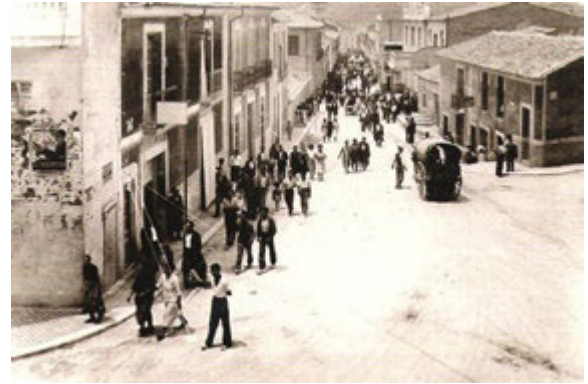
Figura 3. Vista de la calle Gabriel Payá a mediados del siglo XX.

García y Navarro o la empresa de los Chico de Guzmán, las tres principales muestras del trabajo fabril previo a la Guerra Civil. La calle Gabriel Payá acabó concentrando en el primer tercio de siglo, además de algunas viviendas de gente bienestante, los dos teatros locales, el de baix y el de dalt , este último el Teatro Cervantes, un centro de la cultura local; también edificó allí su nueva sede la Cooperativa Agrícola y a ella daban la mayoría de los nuevos cafés donde transcurrían sus momentos de ocio buena parte de los varones más favorecidos, cafés como el de la Estrella, junto al teatro, o como la Gran Peña, algunos de ellos, en ocasiones, con sesiones vermouth dominicales, amenizadas por alguna orquestina.