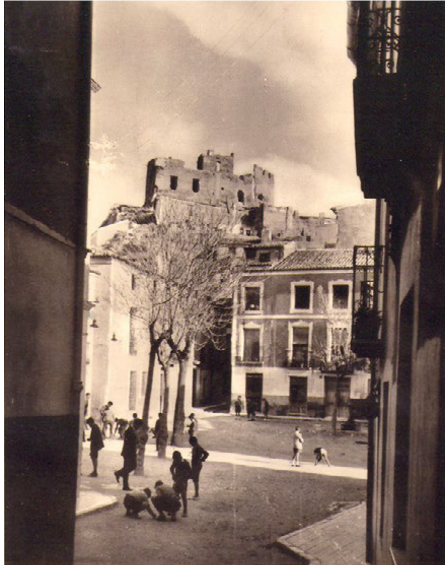
Figura 16. Plaça de Dalt