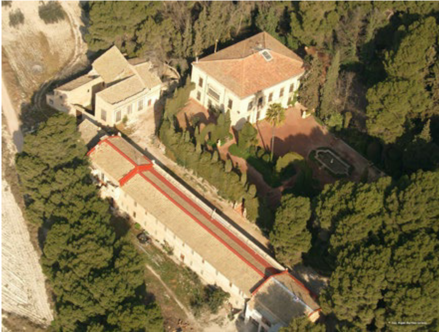
Figura 15. Finca El Poblet, denominada en clave Posición Yuste, donde se situó la residencia del presidente del Gobierno (Fotografía: Juan Miguel Martínez Lorenzo).

también fabricaron calzado civil. Otras, como la cooperativa El Faro, comprobaron cómo en muchas fábricas se trabajaba ya de forma similar a ellos. Algunas, las de García y Navarro o Chico de Guzmán, fueron convertidas en la fase final en fábricas de armamento, modificando incluso la fisonomía de sus locales, como aún podemos comprobar en la Ciudad sin Ley (Fig. 14). Estas fábricas acogieron parte de la Unión Naval de Levante y estaban militarizadas; fueron una estructura fabril autónoma del conjunto de la población, con economato propio, que accedían a un avituallamiento diferente al del resto de los petrerenses. Tenían también su propio refugio, en caso de peligro. Otros varios refugios se construyeron repartidos por el casco urbano.