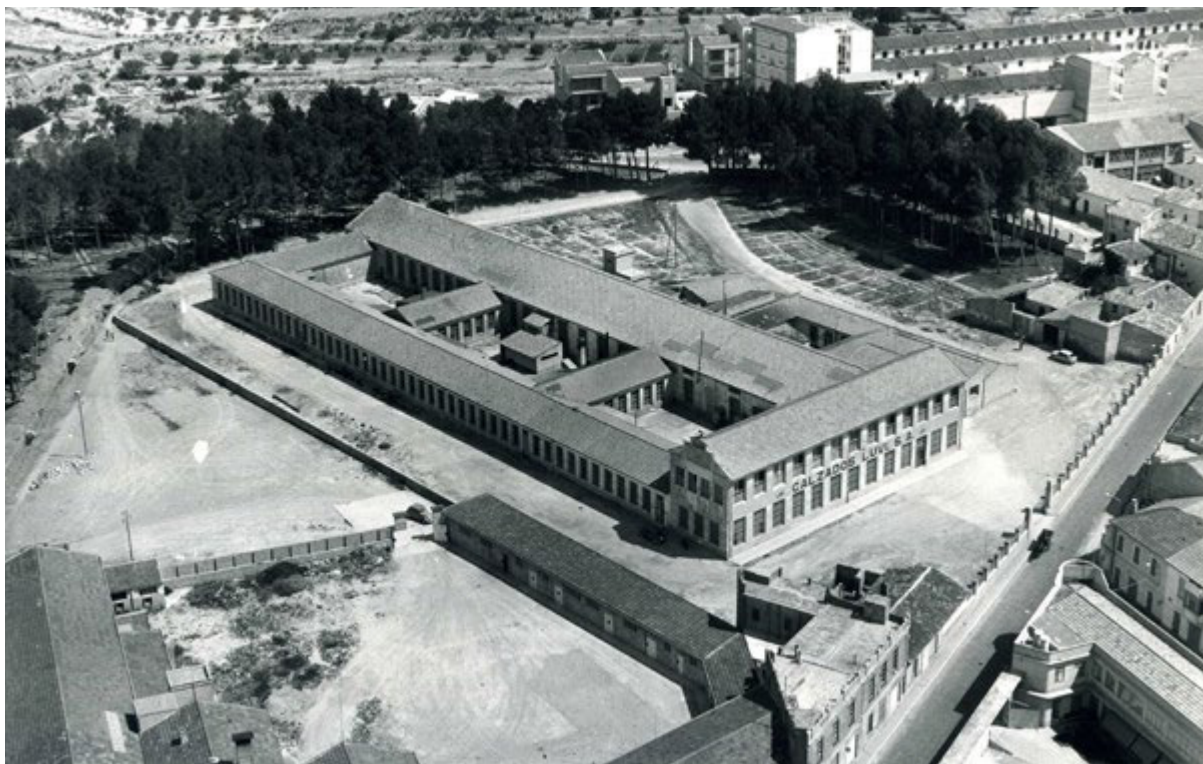
Figura 10 Vista aérea de la fábrica Calzados Luvi.