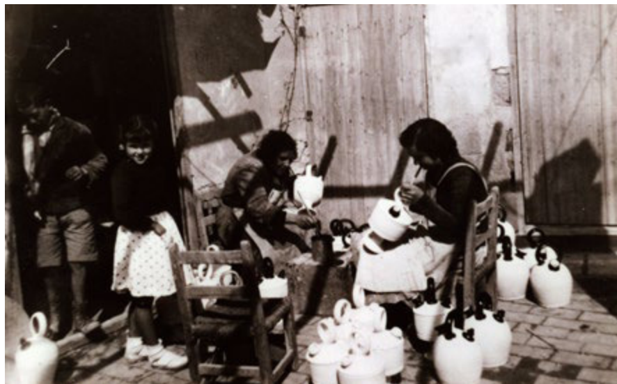
Figura 8. Proceso de pintado de botijos a mano a mediados del siglo XX.