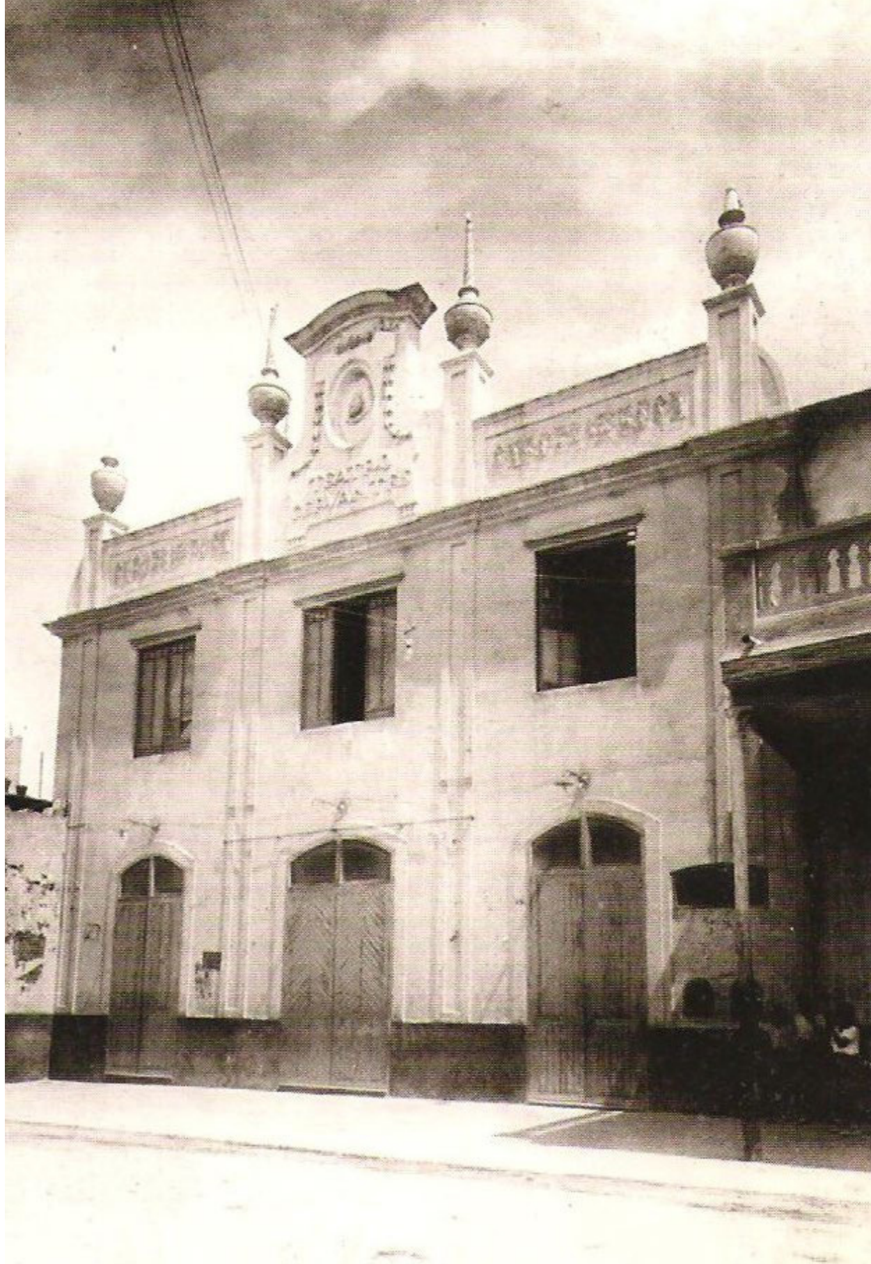
Figura 17. Antigua fachada del Teatro Cervantes.