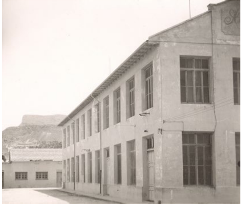
Figura 14. Vista parcial de las instalaciones de la Ciudad sin Ley.

pietarios, jornaleros, implicados en cuestiones políticas o sindicales, ajenos a ellos, gentes encerradas en su propio ámbito familiar o volcadas en una participación social que fomentaba la solidaridad pero también los enfrentamientos. Hemos visto cómo existía en Petrer una burguesía emprendedora —aunque cada vez más escorada hacia el conservadurismo— y un socialismo reivindicativo, cada vez más radicalizado.