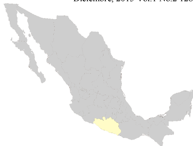
Figura 1 Situación geográfica de México.

A efecto de cumplir el objetivo planteado, se consideraron otros métodos para estudiar ANP como el propuesto por Miller (1980) y Bolós, Bovet & Vilá (1992) con adaptaciones elaboradas por Melo (2002); Melo-Niño (2003 y 2006) y Niño-Melo (2005) y Niño (2005) acordes al caso mexicano. Quienes han contribuido desde la academia, en mayor o menor medida para el conocimiento, aprovechamiento sustentable y declaratoria de algunas de las 174 ANPs Federales de México (Niño, Correa, Saldaña & Valderrábano, 2011: 152).