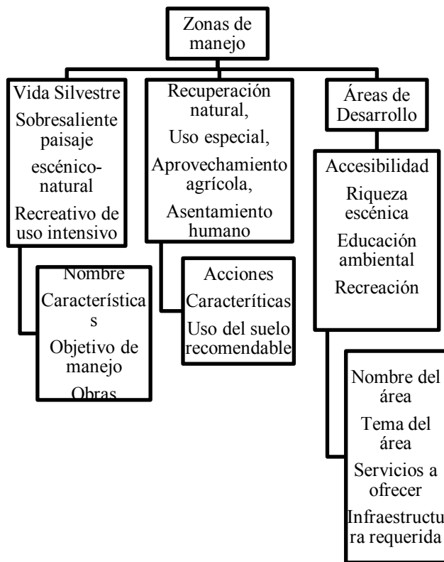
Figura 4 Zonificación.

La zonificación tiene que ver con la localización, altura, morfología, clima, accesos, extensión de los sistemas montañosos, planicies, litorales y costas, lagos, lagunas, cenotes, pozas, aguas termales, ríos, caídas de agua, grutas y cavernas en su relación con manifestaciones ancestrales recopilados en museos, existencia de zonas arqueológicas, sitios históricos, obras de arte y técnicas en la pintura, escultura, arte decorativo, arquitectura, arte y artesanías prehispánicas. Las zonas de manejo son siete: Vida silvestre, Sobresaliente paisaje escénico-natural, Recreativa de uso intensivo, Recuperación natural, Uso especial, Aprovechamiento agrícola y Asentamiento humano (Figura 4).