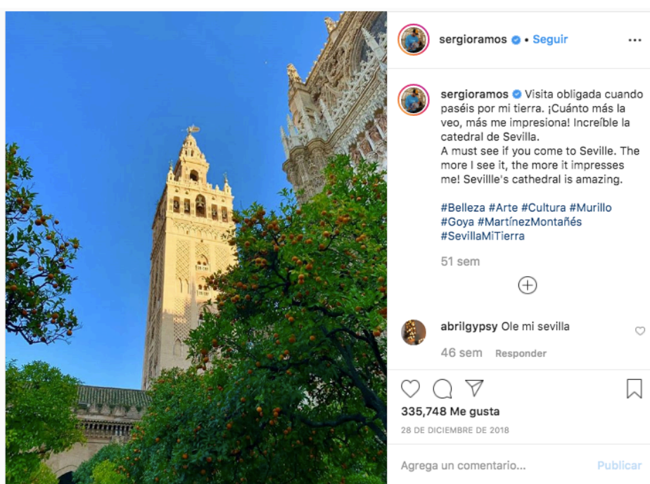
Figura 1. Post de Sergio Ramos (Real Madrid) sobre la Catedral de Sevilla

El contenido de los posts recoge, en todos los casos, la figura del propio futbolista, a excepción del post publicado por Sergio Ramos el 28/12/2018 (figura 1) en el que cede todo el protagonismo de la publicación a la Catedral de Sevilla, a la cual invita a visitar a todos sus seguidores. Estamos, por tanto, ante una promoción turística y cultural.